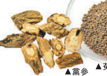
▲黨參 ▲菟絲子 養胎方藥以菟絲子和黨參作「君藥」之用，以補腎養血