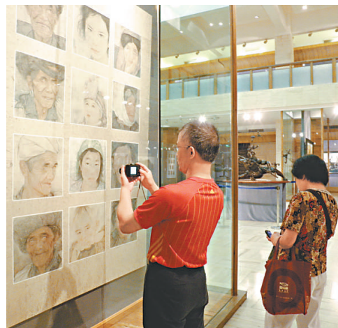
▲觀眾在欣賞展出作品

【本報訊】記者黃寶儀廣州報導：「2012廣東青年美術大展」正在廣州藝術博物院舉行，這是建國以來，廣東省舉辦的面向四十五歲以下青年藝術家規格最高、規模最大的綜合性美術展，展出的四百四十七件作品，包括了中國畫、油畫、版畫、雕塑、水彩粉畫等類別。本次展覽由廣東省委宣傳部、廣東省文化廳、廣東省文學藝術界聯合會、廣東省美術家協會共同主辦，旨在總結廣東美術持續繁榮的成功經驗，以培養後備力量為重點，鼓勵創作具有中國氣派和嶺南特點的精品，倡導具有反映時代特點和創新意識及探索精神的新風格、新式樣的作品。