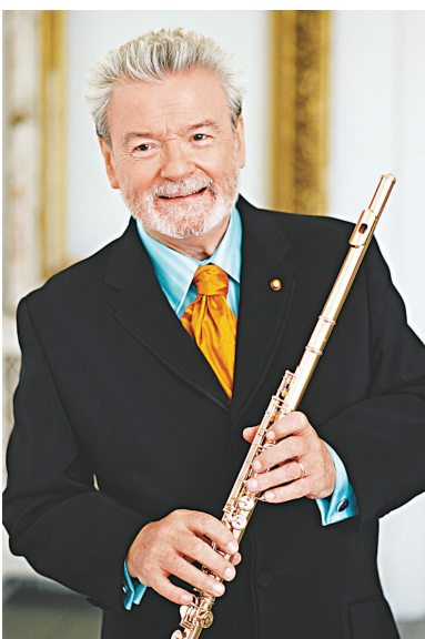
▲占士·高威將擔任長笛獨奏及指揮

占士·高威是具有魅力的音樂家，他是公認的長笛古典樂曲演奏大師，每次出場總能為觀眾帶來完美的視聽之娛。他的樂碟遍全球，而所灌錄的唱片，銷售量超過三千萬張。他不在世界多個國家的電視台亮相，觀