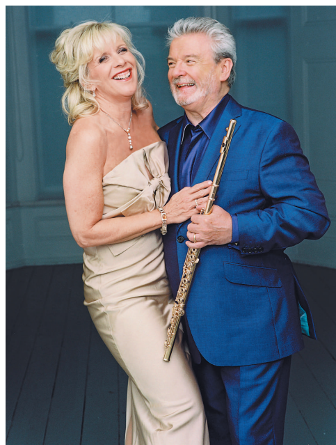
▲長笛演奏家占士·高威夫婦將同台演奏