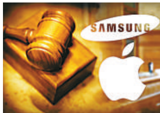
▲三星和蘋果的官司 又起爭端 互聯網

在陪審團判決出爐後，高蘭惠也預定12月6日舉行聽證會，審理蘋果要求永久禁售三星8款智能手機和平板電腦一案。蘋果要求禁售的8款智能手機中，有7款是三星的Galaxy系列產品。