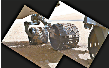
▲這張NASA 10日公布的圖像顯示的是「好奇」號火星車自拍的圖片

壤的詳細圖像，顯示出局部細微的地貌特徵。火星手持透鏡成像儀8日首次在未使用透明防塵罩的情況下拍攝了火星表面照片。