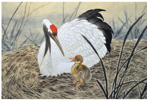
▲二〇一一年作品《親情圖》(局部)