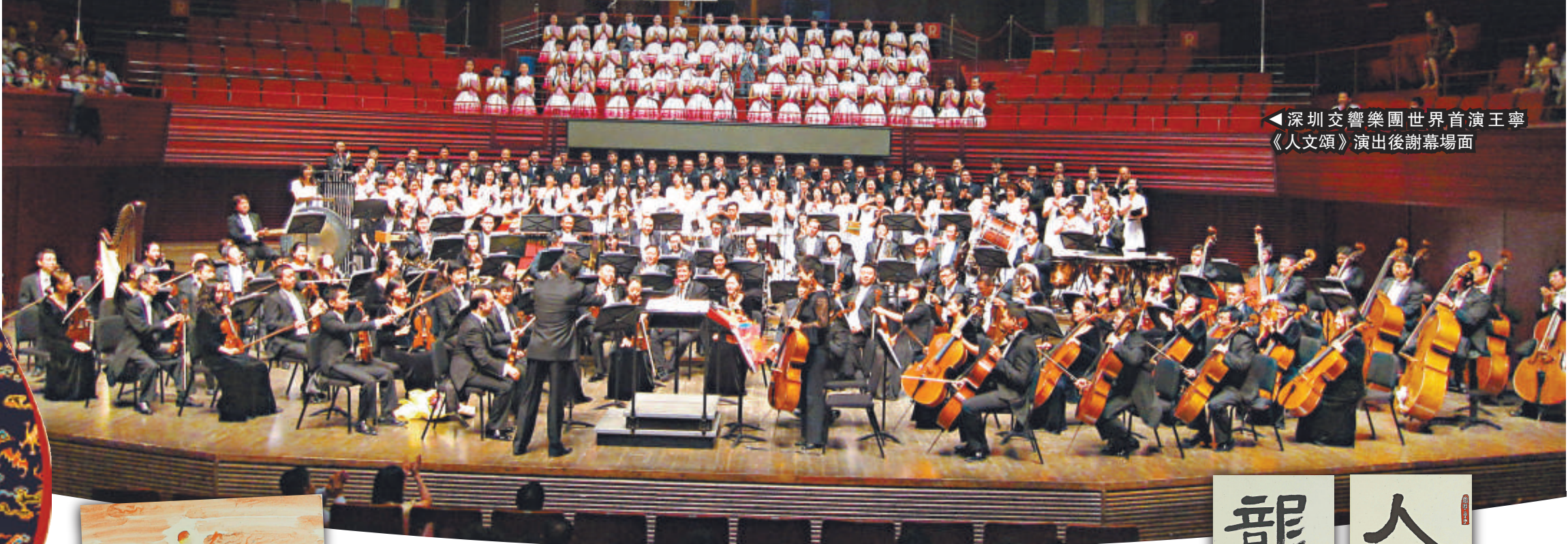
◀深圳交響樂團世界首演王寧《人文頌》演出後謝幕場面