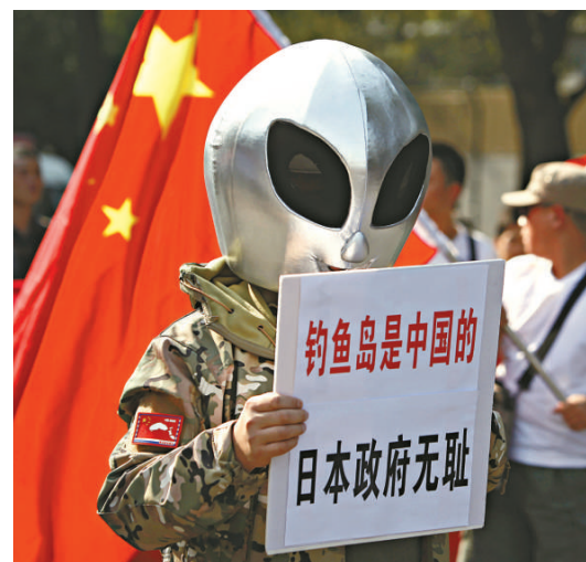
▲北京民衆在日本大使館前抗議遊行

「大陸架是一個國家的領土和資源在海底的自然延伸，對島嶼而言關鍵在於確權，只要確認島嶼屬於該國家，根據《聯合國海洋法公約》的大陸架公約，該國家就可以擁有這些大陸架。」劉江永進一步指出，大陸架屬於沿海國的管轄海域，所涉海底資源，包括所有蘊藏的天然氣、石油、稀土等，都是由所屬國享有專有勘探開發主權。