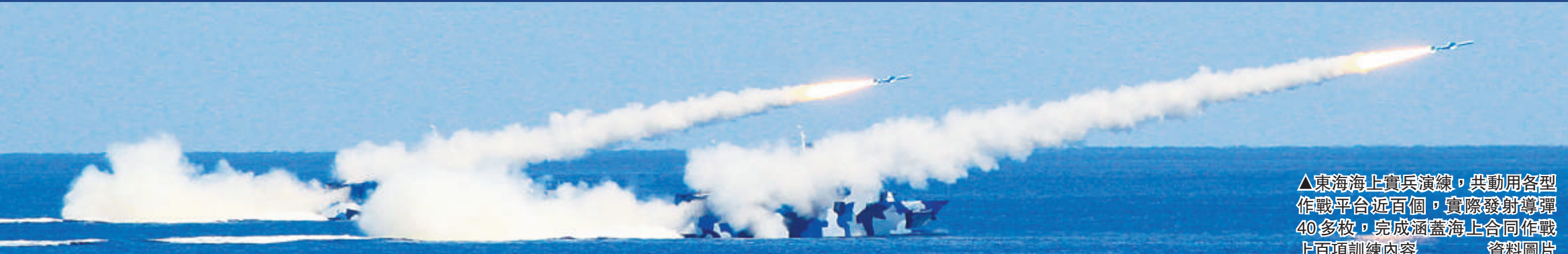
▲東海海上實兵演練，共動用各型作戰平台近百個，實際發射導彈40多枚，完成涵蓋海上合同作戰上百項訓練內容 資料圖片