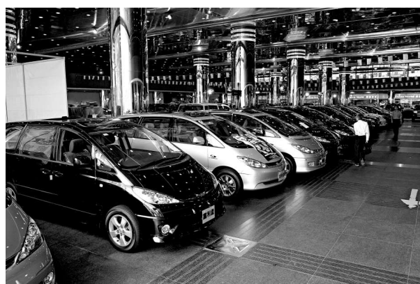
▲消委會提醒私家車主，須留意原廠維修細則和條款

另外，正面撞擊測試中，有五個樣本在某些安裝模式下表現較差，如後向安裝時保護能力不俗，但前向安裝時保護能力顯著減低；有兩款在拆下椅背時保護時，側面撞擊保護能力欠佳。