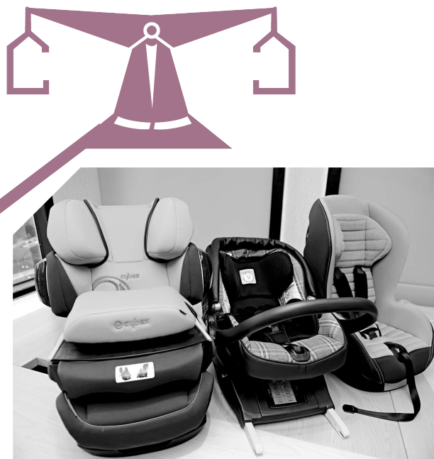
▲消委會公布兒童座椅測試，樣本包括在港有售或將出售的十九款安全座椅