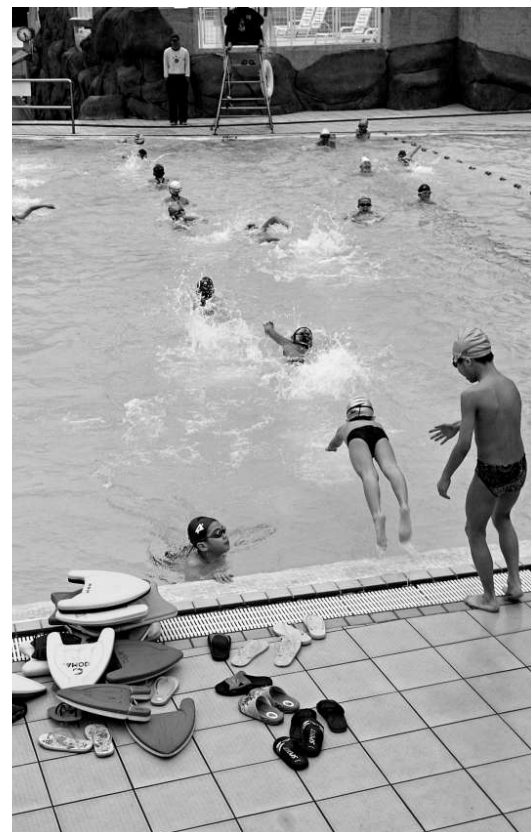
▲家長為幼兒選擇課程或興趣班，宜先了解子女喜好及需要，並預先視察上課環境和設施

消委會又指，高壓推銷在今年七月通過的《商品說明修訂條例》下，可能構成刑事罪行，消費者如遇到應立即離開或報警求助。