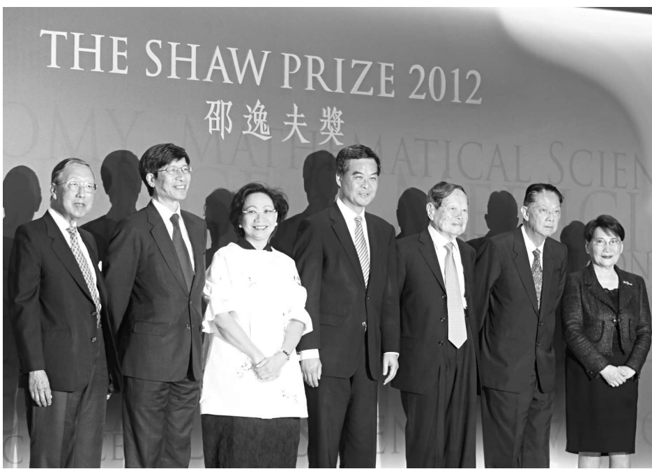
▲梁振英(右四)與夫人唐青儀(右五)出席頒獎禮

「邵逸夫獎」於二〇〇二年十一月宣告成立，以表彰學者在學術及科學研究或應用上在近期獲得的突破成果，和該成果對人類生活產生深遠影響的科學家。自〇四年開始，每年頒發一次，每項獎金100萬美元。今年為第九屆。本報教育版將陸續刊出得獎者的訪問。