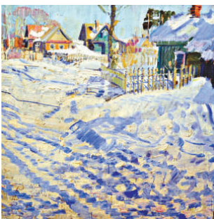
▲參展畫作《明媚的冬天》 ▲參展畫作《石油鑽井台》 ▲參展畫作《莫斯科紅場》