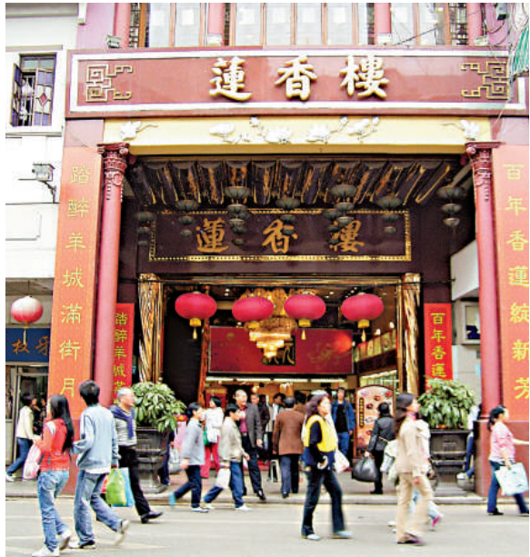
▲廣州蓮香樓享有「中華老字號」、「蓮蓉第一家」之稱 本報記者方俊明攝