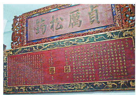
▲圖下方為清道光年間滿漢文聖旨匾