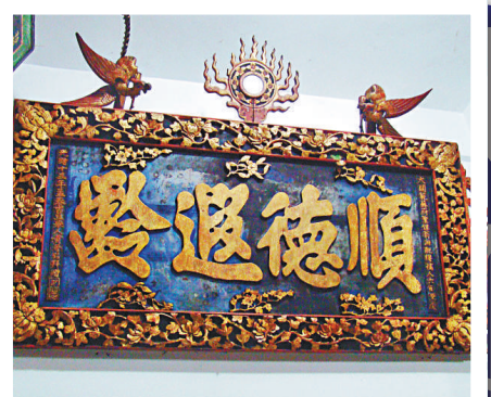
▲橫長形的為匾，流行於明清時期。許多匾額都經過精湛的雕刻，顯得富麗堂皇