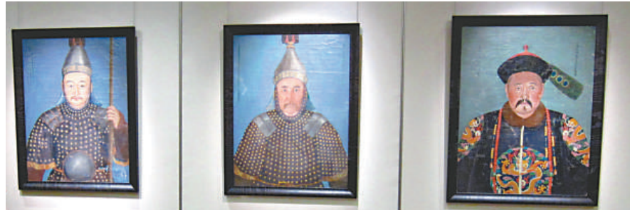
▲「歐洲珍藏御製功臣像」其中三幅