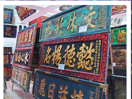
▲陳列館中隨處可見匾額