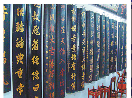
▲陳列館中懸掛的楹聯