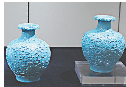
▲暫得樓藏清乾隆松石綠釉浮雕纏枝番蓮紋石榴尊一對，估價二千萬元至三千萬元