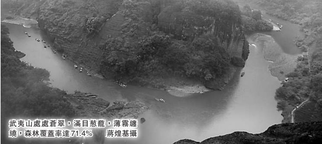
武夷山處處蒼翠，滿目蔥蘢，薄霧纏繞，森林覆蓋率達71.4%

據南平市長林寶金介紹，南平市已制定發展綠色經濟，打造綠色城鄉，建設綠色新區，保護綠色生態，全力創建全國綠色發展示範區的發展新思路。本報記者 蔣煌基