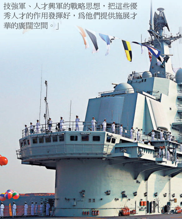
▲「遼寧艦」艦島可見方型有源相控陣雷達 新華社