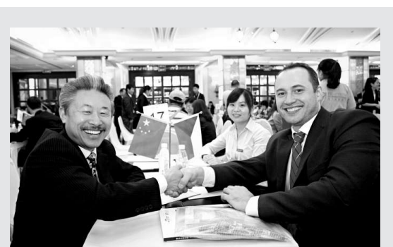
▲近400家中方企業與歐洲國家企業開展「一對一」洽談對接，洽談場次達1000場以上。

報道稱，在11日日本政府宣布釣魚島「國有化」之後，中國已表示將採取堅決反制措施。中國加強了對日本進口商品的海關檢查力度，同時延遲向日本商務人士發放工作簽證。