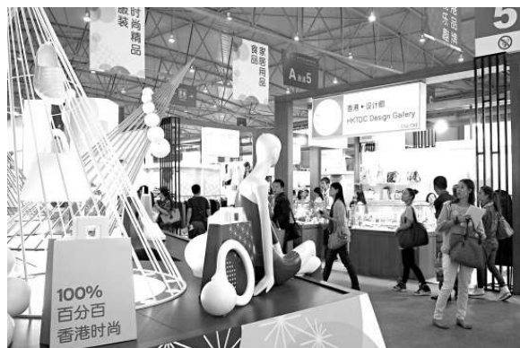
100% 百分百 香港時尚

據報道，這項調查是以1441家會員企業為對象，於本月20日開始實施的。以上結果是到21日為止的150家企業的回答分析。