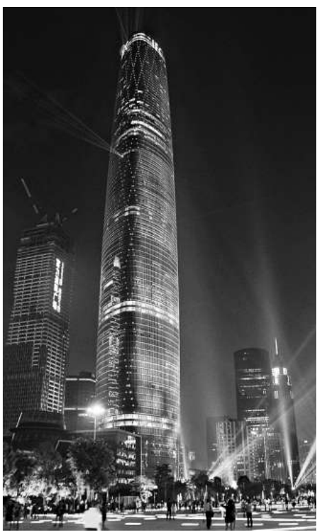
廣州國際金融中心26日全面開業。該中心位於珠江新城金融核心區，其中包括甲級寫字樓、高端商場、五星級酒店、服務式公寓及國際會議中心等五大業態。新華社