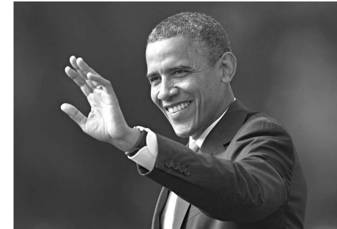
▲美國總統奧巴馬26日離開白宮，前往俄亥俄州進行造勢活動