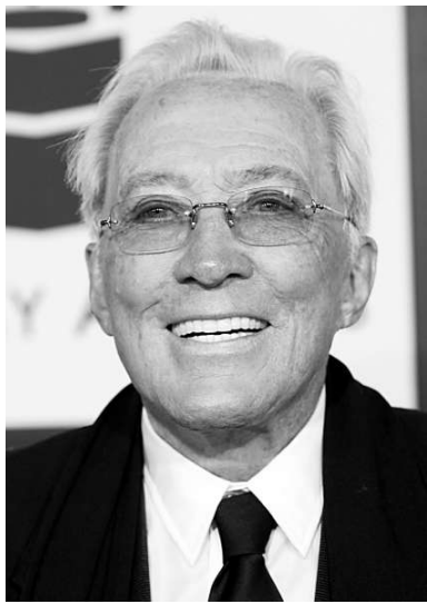
美國歌壇傳奇人物安迪威廉斯資料圖片

【本報訊】綜合英國廣播電視台、中央社26日消息：與膀胱癌抗爭一年之後，以「月亮河」(Moon River)聞名的美國歌壇傳奇人物安迪威廉斯辭世，享年84歲。