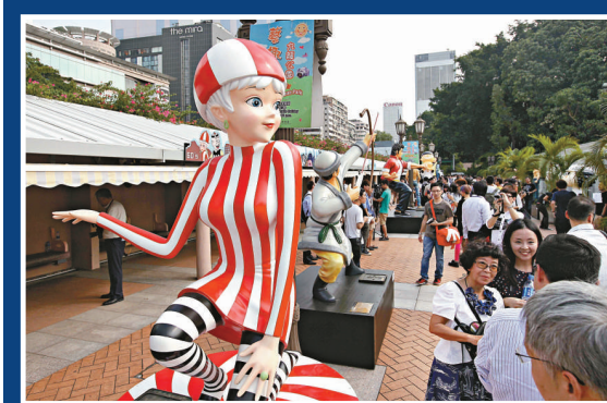
▲香港漫畫星光大道或可為香港打造一個嶄新的旅遊新地標

月及明年三月中至六月，逢星期六及日在大道內為遊客詳細介紹有關的內容，並配以廣東話、英語及普通話作為導賞語言。