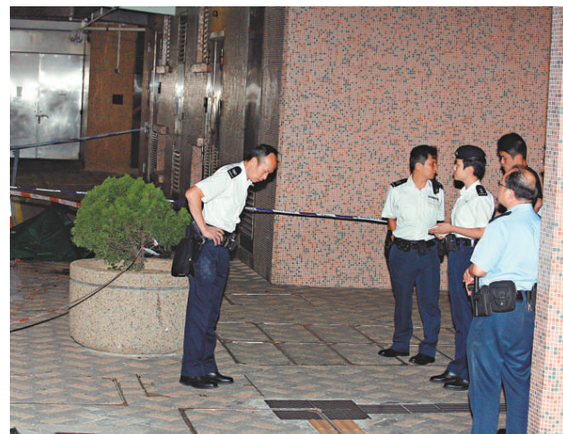
▲現場為秀茂坪邨秀賢樓