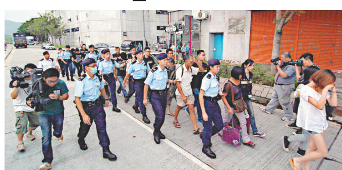
▲警方昨日在上水劍橋廣場拘捕三十名持雙程證人士，懷疑是水貨客

【本報訊】入境處與警方昨再度進行打擊水貨客的「風沙行動」，在上水劍橋廣場拘捕三十名持雙程證人士，懷疑他們是水貨客及違反逗留條件。