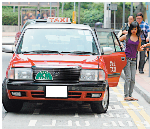
▲有的士業界人士指出，由於內地客在內地慣於上車前和司機講數，令本港劊司司機得以漫天開價

被告在庭外表示，他當搬運散工每天只賺一百六十元，但住所月租每月要七千元，經濟負擔沉重。他又說任職司機二十年，經常眼見其他司機用假鈔、盜竊等方法行騙乘客，自己則只是一時貪心才干犯罪行。