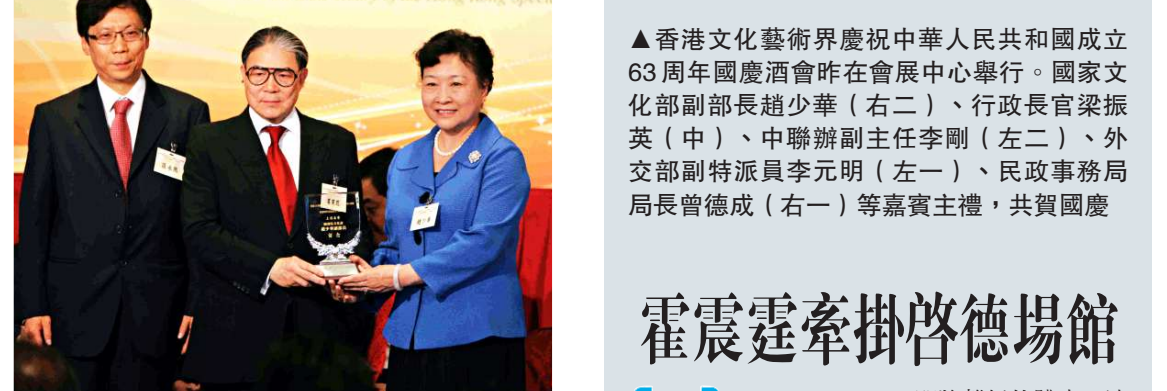
▲香港文化藝術界慶祝中華人民共和國成立63周年國慶酒會昨在會展中心舉行。國家文化部副部長趙少華（右二）、行政長官梁振英（中）、中聯辦副主任李剛（左二）、外交部副特派員李元明（左一）、民政事務局局長曾德成（右一）等嘉賓主禮，共賀國慶