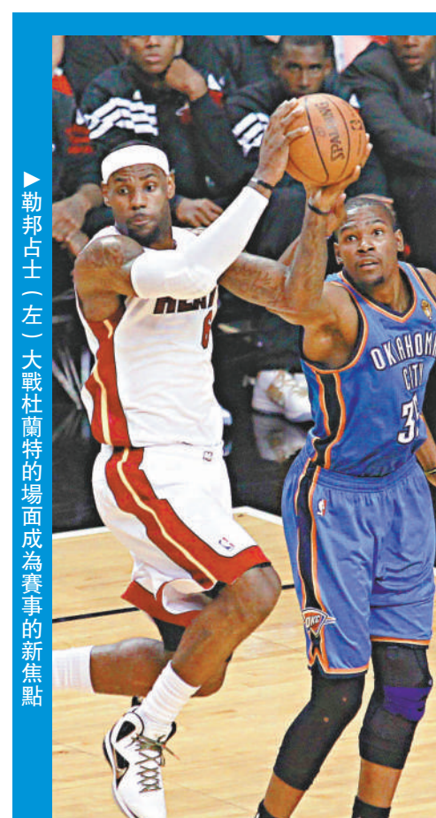
勒邦占士(左)大戰杜蘭特的場面成為賽事的新焦點