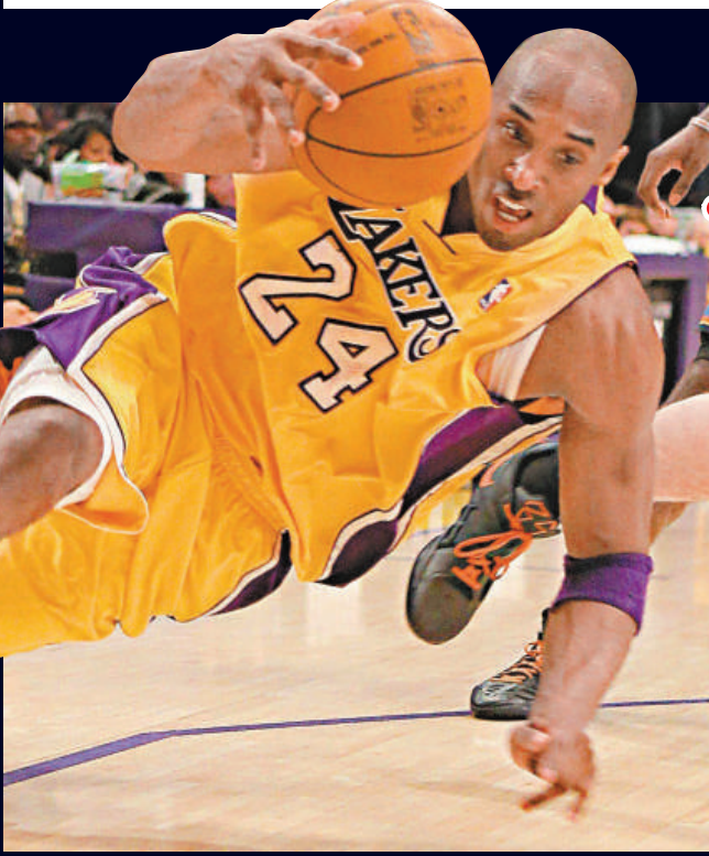
勒邦占士崛起，NBA的打法亦有所改變