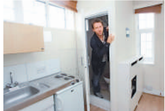
▲倫敦最細套房內部實景

物業代理公司Hunters的一名董事法因說：「我在倫敦做經紀30年，從未賣過這麼小的物業。我可以站在房間中央並摸到牆壁！但買這個也蠻不錯——這裡地點很優越。」這個單位所處的布朗普頓道Prince's Court大樓，有9個小單位。它們一度被用來儲物，然後才被改建成套房。