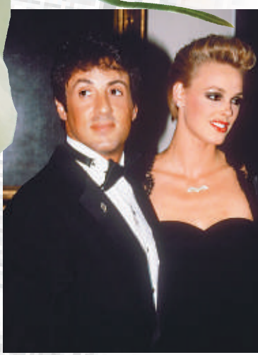
►尼爾森與史泰龍有短暫婚史 英國《每日郵報》