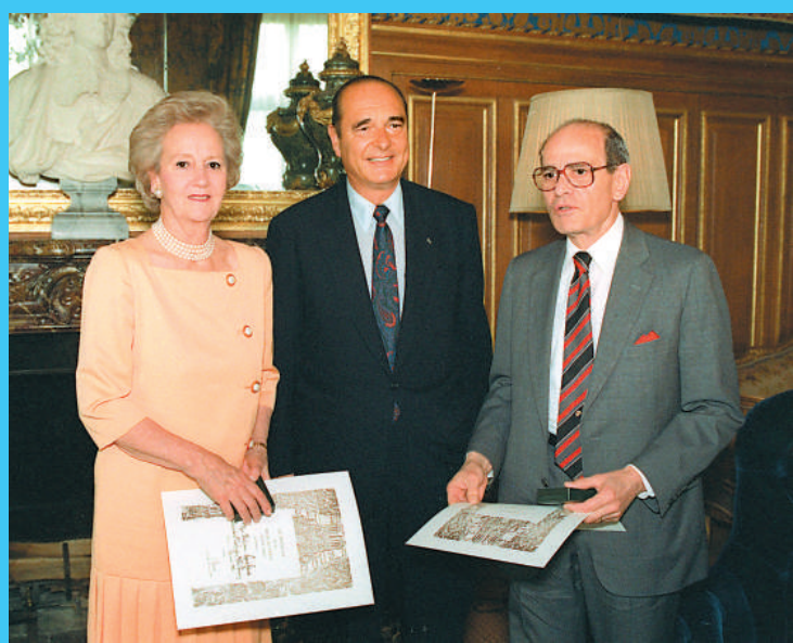
▲1992年，時任巴黎市長的希拉克（中）授予蘇茲貝格（右）「巴黎城市獎章」