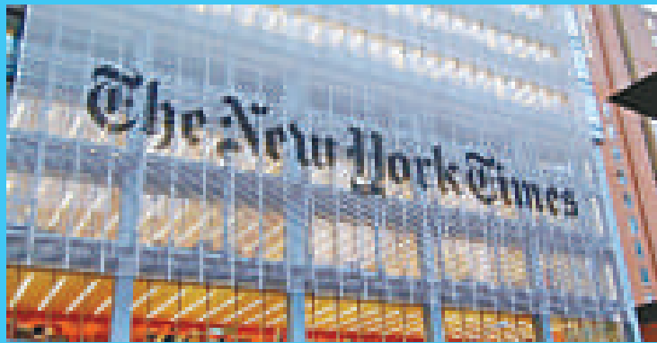
▲紐約時報集團總部大樓 互聯網