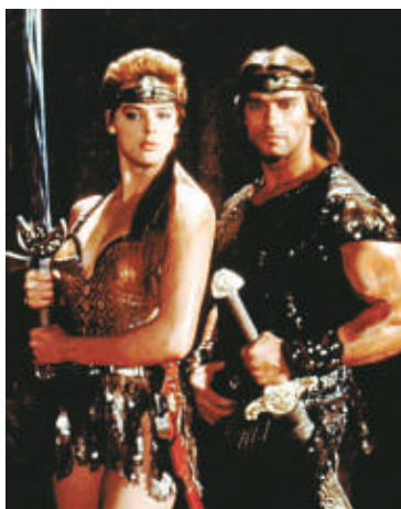
►阿諾1985年與尼爾森一起拍攝動作片《女王神劍》

尼爾森前後結過五次婚。在結束了與阿諾的交往後，她在1985年底嫁給了阿諾的好友、荷里活動作巨星史泰龍。但這段婚姻只維持了19個月。