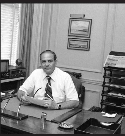
▲1977年的蘇茲貝格，照片攝於其紐約辦公室 資料圖片

紐約時報公司旗下媒體包括《紐約時報》、《國際先驅論壇報》和《波士頓環球報》等。作為紐約時報公司的旗艦媒體，《紐約時報》創刊於1851年，迄今共獲得108次普立茲獎，是美國獲得普立茲獎最多的媒體。