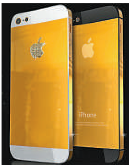
►iPhone 5新轉插器供應不足，用戶大呼不滿 互聯網