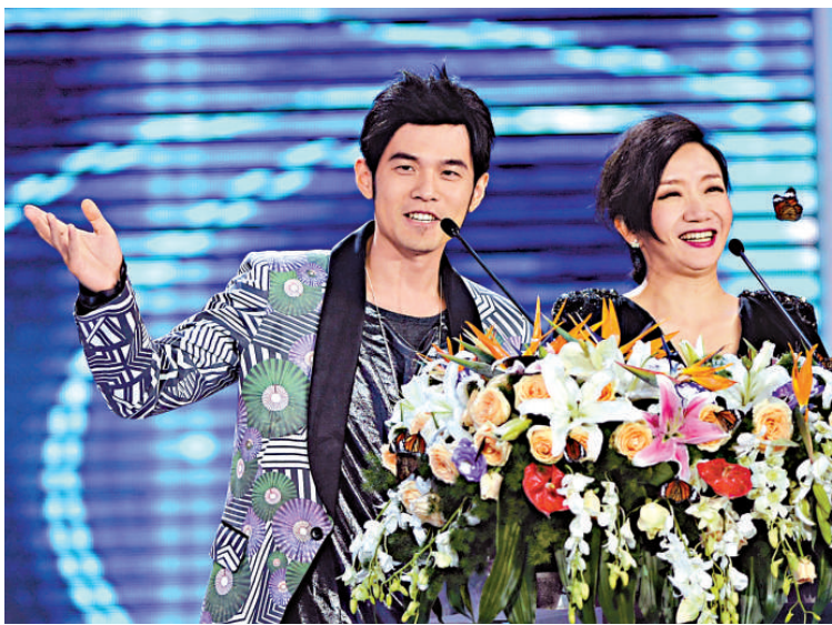
▲周杰倫(左)出席頒獎禮

此外，《唐山大地震》膺最佳影片，兼得最佳導演(馮小剛)、最佳編劇(蘇小衛)及最佳新人(張子楓)；孫淳、寧靜憑《辛亥革命》包攬男女配角獎，金雞獎終身成就獎得主包括王為一、嚴寄洲。另外，優秀故事片的得獎電影為《辛亥革命》及《失戀33天》。