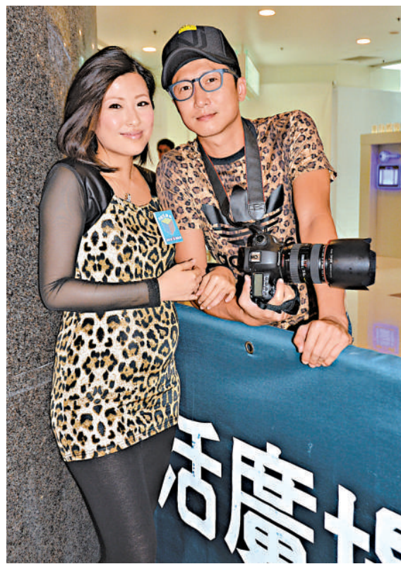
▲天明(右)陪家蔚開工，順道幫老婆影相