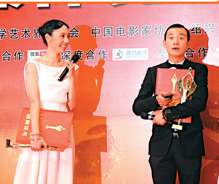
▲文章(右)、白百合喜獲百花影帝、影后