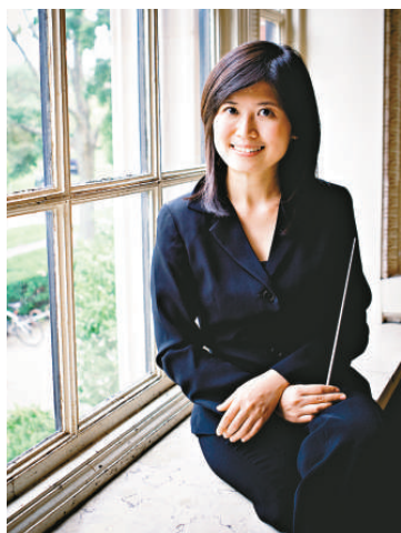
泛亞交響樂團將演出和介紹不同的敲擊樂器

【本報訊】康樂及文化事務署於十月獻上泛亞交響樂團三場音樂會，名為「敲擊樂嘉年華」，由團員演出和介紹不同的敲擊樂器。