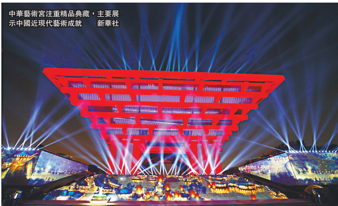
中華藝術宮注重精品典藏，主要展示中國近現代藝術成就

兩館的重開為上海增添了兩張文化新名片。上海作為中國近代美術的發源地，匯聚了數百萬件藝術作