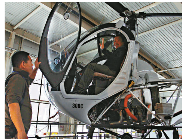
▲一位長春市民在首屆長春國際時尚生活用品展上了解直升飛機的性能