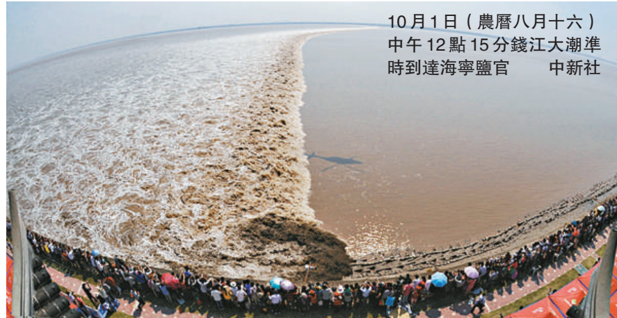
10月1日（農曆八月十六）中午12點15分錢江大潮準時到達海寧鹽官 中新社

「與往年一樣，景區很早就做好了安全措施。」張冰瑜在接受記者採訪時表示，鹽官景區歷年來無一例觀潮安全事故發生，屬於錢塘江邊最安全的觀潮區域。（中新社）