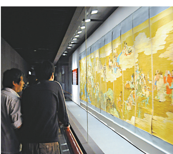
▲觀衆在「國之瑰寶」展廳有序參觀任伯年的《群仙祝壽圖》

據了解，中華藝術宮和當代藝術博物館經過了長假的試運營，還將進行調整，特別是為應對更大客流而做好準備。