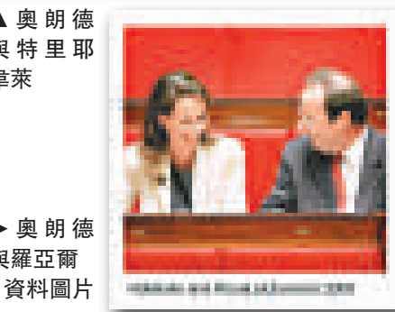
▶奧朗德與羅亞爾 資料圖片