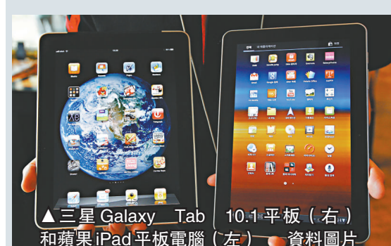
▲三星Galaxy Tab 10.1平板（右）和蘋果iPad平板電腦（左）

三星和蘋果這兩大智能手機製造商在全球互控彼此侵犯行動裝置設計和技術專利，在規模高達2190億美元的全球智能手機市場上爭奪霸主地位。