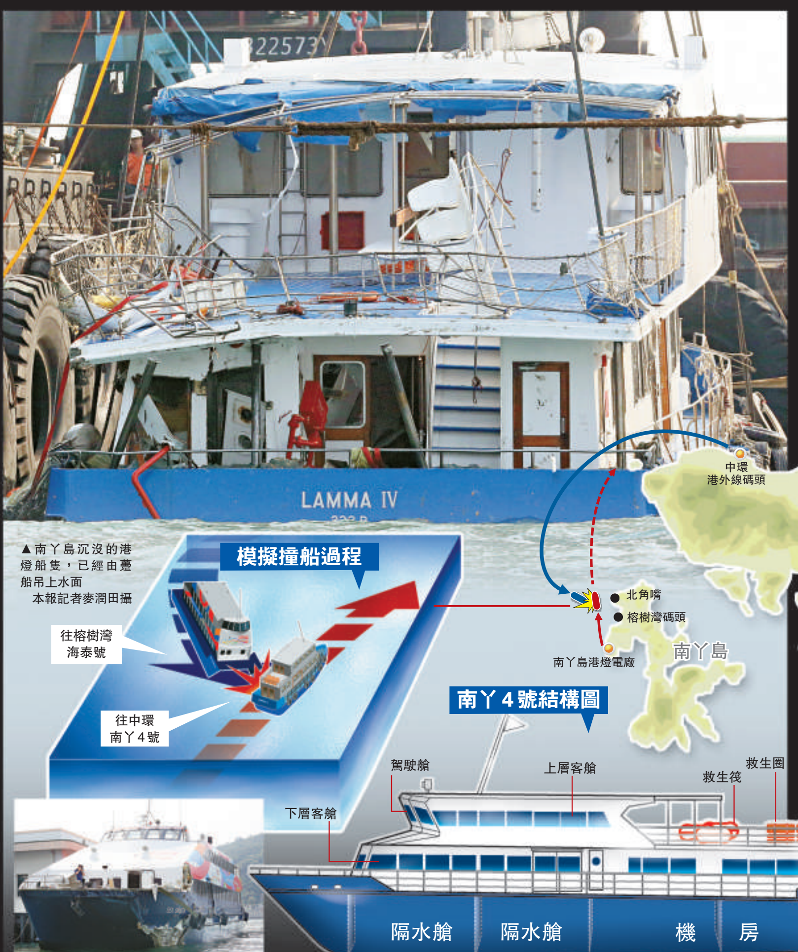
▲南丫島沉沒的港燈船隻，已經由臺船吊上水面

船長：28米 船闊：8.1米 載容量：409人 最大航速：25節（50公里） 船主及用途：港九小輪公司，主要行走南丫島榕樹灣至中環航線