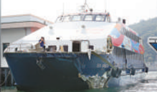
▲海泰號撞船後停泊碼頭，船頭左側損壞