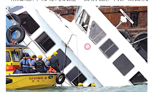
▲拯救人員在現場搜救死傷者

觸不多，所得資料有限，故稍後才會發聲明。發言人又說，涉及意外的船長有一定資歷，熟悉意外現場的航道，目前在伊利沙伯醫院