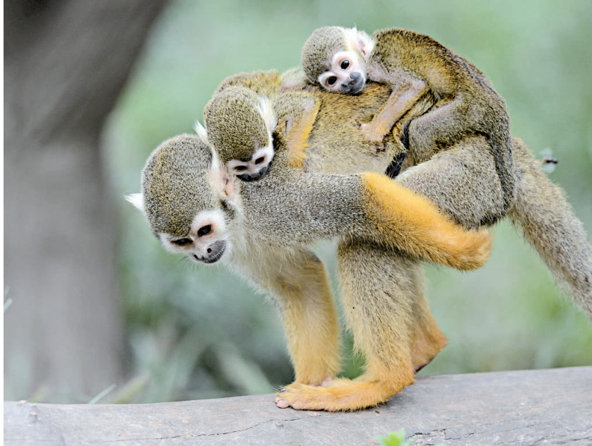
▲松鼠猴媽媽背着自己出生的雙胞胎寶寶小心翼翼地走