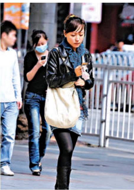
▲收到朋友節日問候短信本不是樂事，但千篇一律的群發短信，卻讓人不是滋味