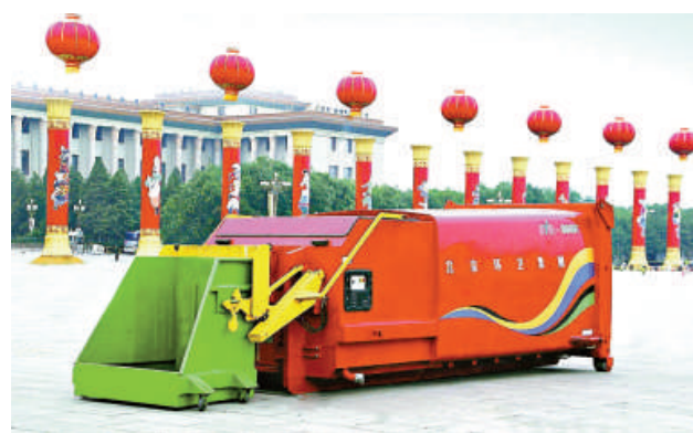
▲國慶日天安門廣場的垃圾量比往年大幅增加25%。圖為當局出動機動車清理垃圾