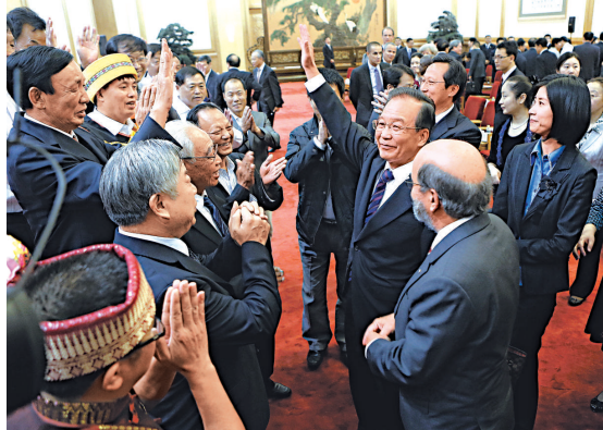
▲溫家寶向出席頒獎儀式的有關部門負責人、農業科技專家學者以及聯合國駐華代表等揮手致意