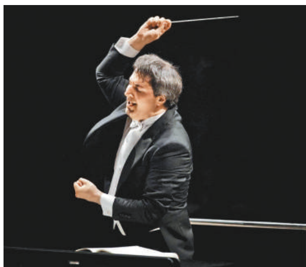
▶丹尼爾·萊斯金將與深圳交響樂團攜手，演繹俄國作曲家作品