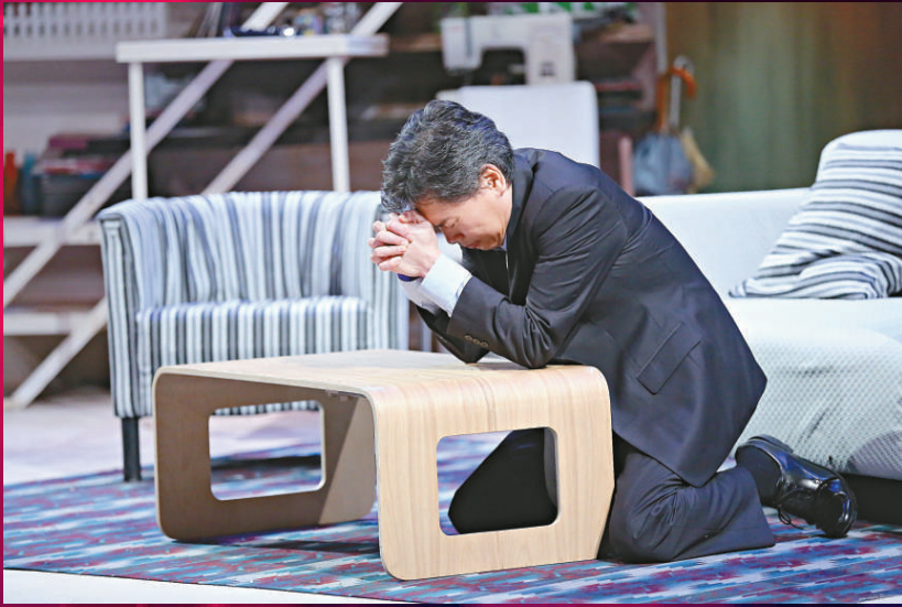
▲阿祖期望從信仰中尋求救贖