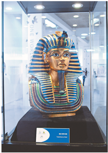
▲埃及駐華使館展出的作品《圖坦卡蒙半身像》

【本報訊】記者李銳北京報導：「藝術·經典——中國國家畫院美術作品展」近日在北京宋莊舉行。孫其峰、黃永玉、袁運甫等五百名藝術家創作的近千幅藝術作品此間集中亮相。