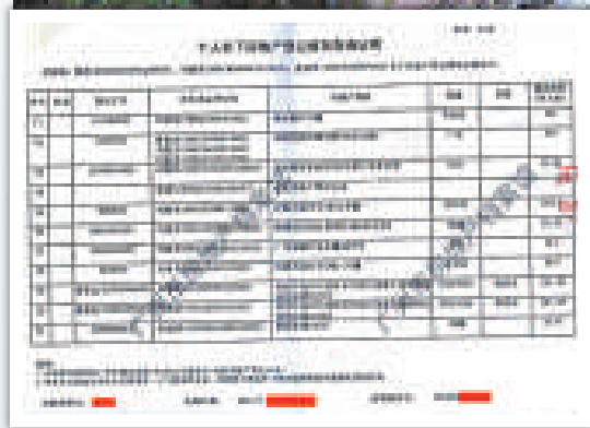
◀這份《個人名下房地產登記情況查詢證明》被網友傳到論壇上後引起軒然大波