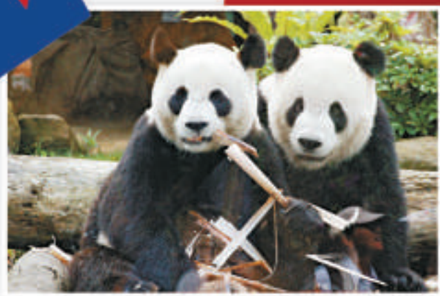
大陸早在2005年就同意將大熊貓「團圓」送給台灣，但當時陳水扁當局拒絕接受。2008年5月馬英九上台後，兩岸的關係迅速獲得改善，「團圓」、「團圓」才得以落戶台北。資料圖片

台灣方面於2009年6月30日起開放陸資赴台投資，至2012年8月底大陸企業赴台投資總金額為3.24億美元。