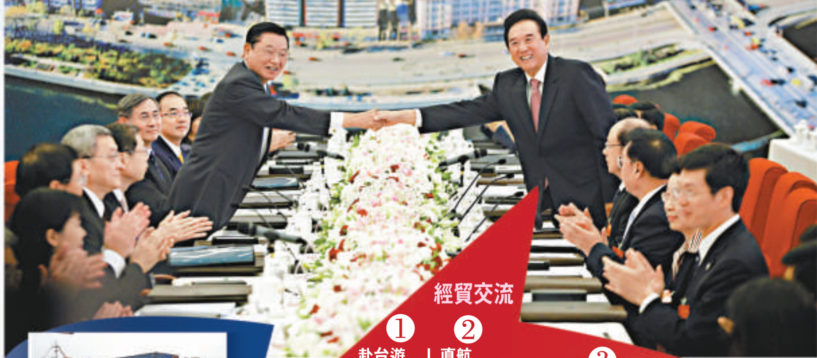
大陸海協會和台灣海基會於2008年6月恢復了中斷近9年的制度性協商，標誌著兩岸關係從谷底回升。圖為海協會會長陳雲林和海基會董事長江丙坤在去年第七次兩會會談前握手。