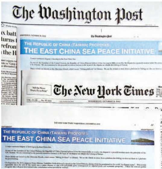
▲台灣近日在全美4大報刊登保釣廣告 資料圖片

此外，台北市政府8日起在市政府大樓、舊市議會及部分捷運站點燈箱，掛出巨幅釣魚島圖像，並書寫「釣魚台是中華民國的」中英對照文字。另在不少外籍人士出入頻繁的商圈，甚至「日本交流協會」附近的慶城街，也掛了很多類似的看板和燈箱，向在國際人士宣傳的意味濃厚。「雙十節」當天，台北市長郝龍斌特地將保釣與「雙十節」結合，除了在