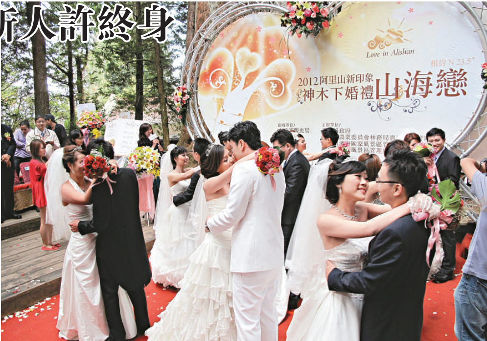
▲來自海峽兩岸的12對新人，12日參加「阿里山神木下婚禮」，在香林神木的見證下，新人在神木下擁吻，互許終身