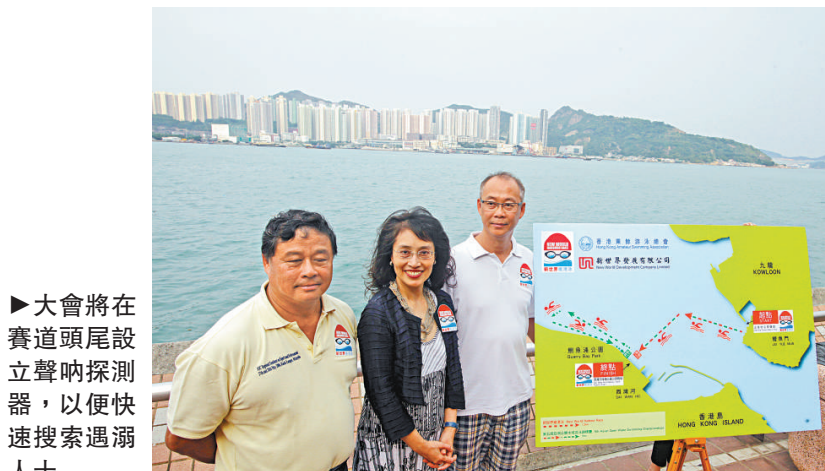
▶大會將在賽道頭尾設立聲吶探測器，以便快速搜索遇溺人士

第五屆亞洲公開水域游泳錦標賽亦會與維港渡海泳同步舉行，來自八個國家及地區的二十八位泳手將同場較量，當中包括四名香港選手。參賽者同樣由鯉魚門三家村出發，在西灣河海濱公園前與渡海泳選手游向不同方向，到達賽事終點，大會將安排人手指示方向。