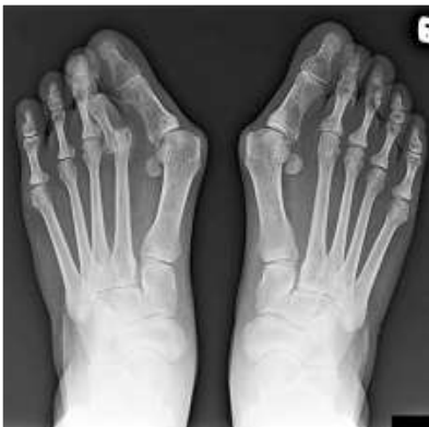
◀有病人因長年穿著高跟鞋導致拇趾外翻