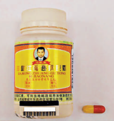
▲衛生署呼籲市民不要購買或服用「甲茸壯骨通痹膠囊」

【本報訊】一名有關節痛病的男子，服用在內地購買名為「甲茸壯骨通痹膠囊」的口服產品長達超過十年後，出現急性心臟病及腎衰竭，被送入醫院。醫院管理局化驗發現，該口服產品含有十三種未標示西藥成分，呼籲市民不要購買及服用該藥。