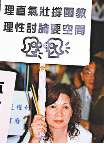
▲市民手持「撐國教」標語

警方以旗杆為界，將支持及反對國教兩批團體一左一右在廣場兩邊集會，由警員及鐵欄分隔，但兩個陣營個別人士在場外以粗言指罵及互相推撞，要由警員組成人鏈將兩批人士分開，反國教團體的學民思潮和家長關注組發言其集會有六千人出席。