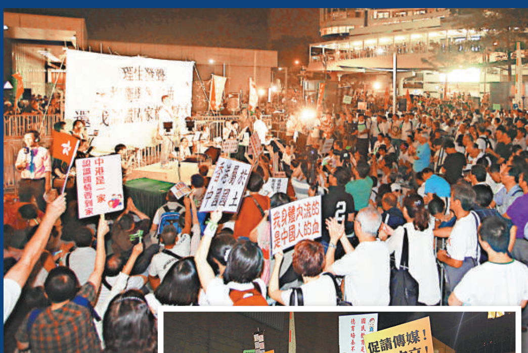
▲逾二千名「撐國教」市民昨日於政府總部廣場舉行集會，高叫「國民教育，有國必讀」口號 本報記者杜漢生攝