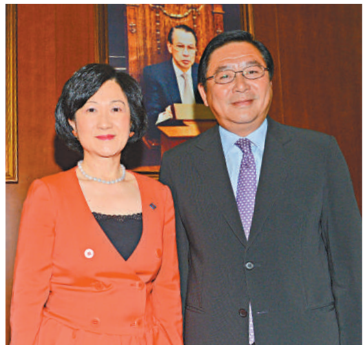
▲林健鋒和葉劉淑儀(左)獲委任為行會成員

【本報訊】記者王欣報道：特首梁振英昨宣布委任立法會議員林健鋒和葉劉淑儀為行政會議非官守議員，即時生效。梁振英稱讚兩人有豐富議會及公共服務經驗，致力為香港的發展作出貢獻，很高興他們能夠加入行政會議。梁說，新增兩名立法會議員可進一步加強行政立法關係，以及協助特區政府制定更能夠回應市民訴求的政策。