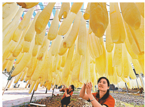
► 17日，江西美爾絲瓜絡有限公司員工在晾曬絲瓜絡。

江西東鄉縣天然絲瓜絡專業合作社自2007年成立以來，採取「省級龍頭企業+合作社+基地+農戶」的生產模式，種植絲瓜並開發14個系列、176個品種的絲瓜絡新產品，其中4個產品獲國家專利、5個產品被認定為有機產品，遠銷到美國、韓國、日本、德國、阿聯酋等地，走出了一條「以品牌為紐帶，龍頭企業為主體，基礎建設為依託，農民參與為基礎」的有機產品產業化之路。