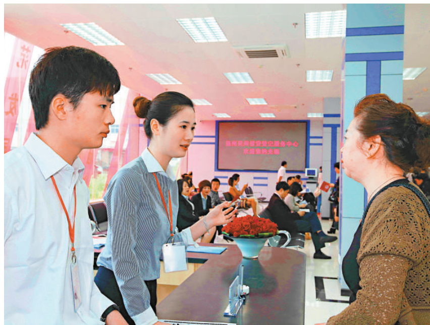
▲溫州民間借貸登記服務中心今年4月成立以來，登記的借貸需求逾二千筆。圖為服務中心工作人員在接受客戶諮詢。