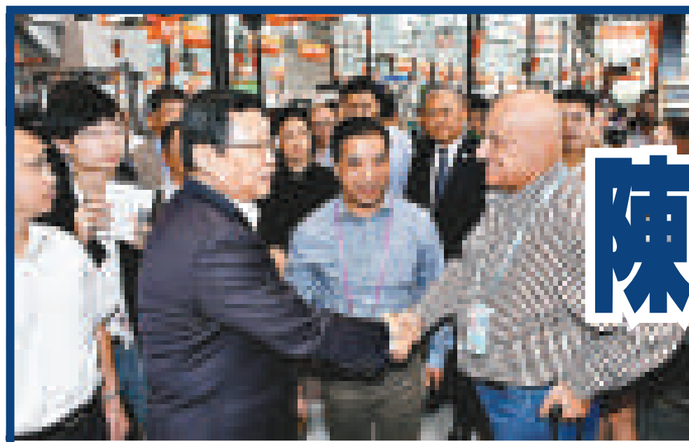
▲▼ 15至16日，商務部部長陳德銘在廣州調研外貿工作，並考察了廣交會部分展商務部網站