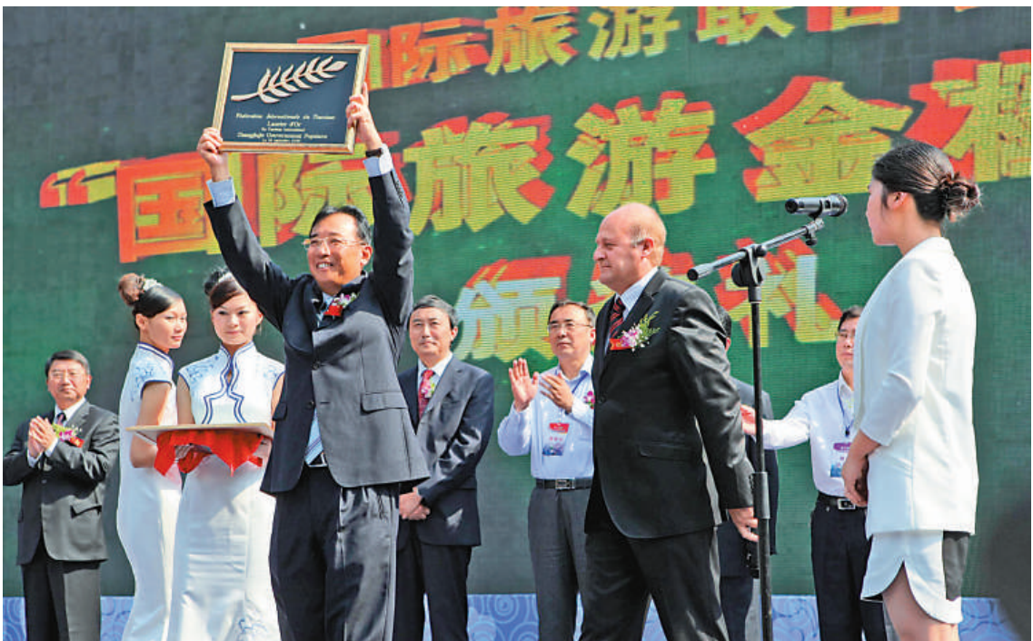
張家界獲國際旅遊組織「金桂獎」

近年來，張家界森林旅遊產業發展迅速，2011年，張家界市森林旅遊人次超過1800萬，佔全市旅遊總人次3041萬的近2/3，圍繞森林旅遊的考察觀光、休閒度假、康體療養成為吸引國內外遊客的最大王牌，全市森林旅遊社會綜合產值超過了100億元。