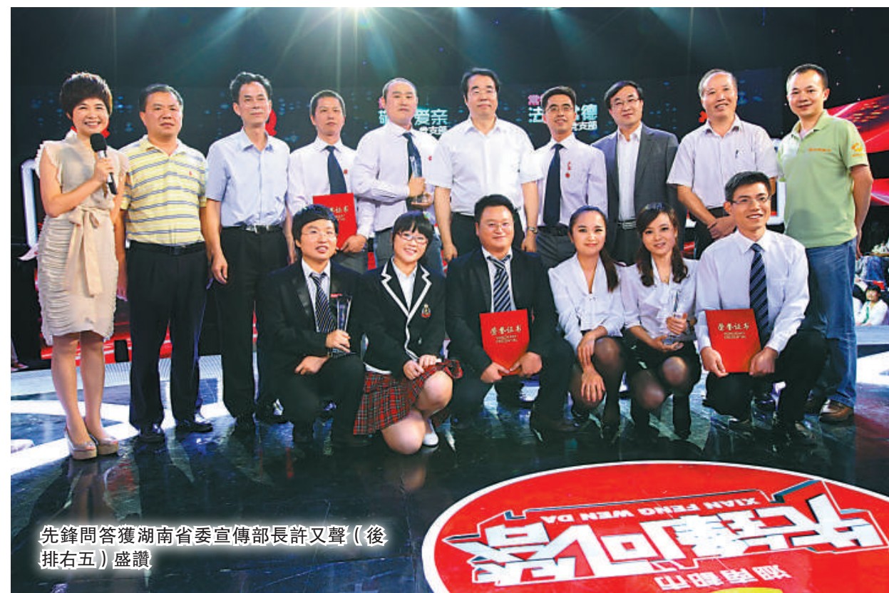
先鋒問答獲湖南省委宣傳部長許又聲（後排右五）盛讚

由湖南建設學習型黨組織工作領導小組、湖南省委宣傳部主辦的湖南大型紅色益智問答節目《先鋒問答》近日在湖南大眾傳媒學院完成錄製。經過激烈爭奪，來自常德「法治常德」黨支部從進入決賽的五支中共黨支部代表隊中脫穎而出，奪得總冠軍。