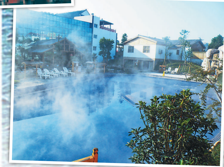
美麗的金太陽溫泉度假村

張家界江垭溫泉 ——江垭溫泉度假村是張家界第一家溫泉度假村，也是目前湘西唯一仿古式半露天溫泉。建有20餘種各具特色、各富功效的高標準露天溫泉池和室內溫泉池。江垭溫泉水質清澈碧透，水溫常年在54度左右，富含對人體有益的多種礦物質元素。