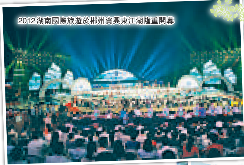
2012湖南國際旅遊節於郴州資興東江湖隆重開幕