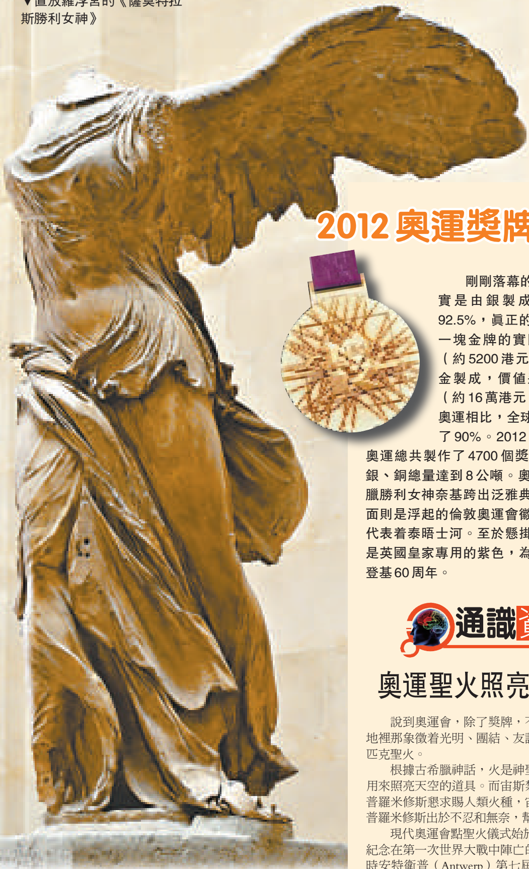
▼置放羅浮宮的《薩莫特拉勝利女神》