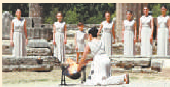
▲女祭司採集奧運聖火火種

說到奧運會，除了獎牌，不得不提的就是在主場地裡那象徵著光明、團結、友誼、和平、正義的奧林匹克聖火。根據希臘神話，火是神聖不可侵犯，也是宙斯用來照亮天空的道具。而宙斯禁止人類使用火，即使普羅米修斯懇求賜人類火種，宙斯也沒有答應，最後普羅米修斯出於不忍和無奈，幫人類偷取了火。現代奧運會點聖火儀式始於1920年，當時，為了紀念在第一次世界大戰中陣亡的協約國官兵，在比利時安特衛普（Antwerp）第七屆奧運會的開幕式上，第一次點燃了象徵光明的火炬。1928年國際奧委會通過決議，今後每屆奧運會都要在主會場上點燃聖火，一直到奧運會結束。直到1936年柏林第11屆奧運會時，奧運聖火才第一次正式採用接力傳遞火炬的形式，在終點主會場點燃聖火。接力傳遞火炬和點燃聖火也從此成了奧運會開幕式上一項隆重、壯觀的儀式，而且是各屆奧運會最重要的活動。因為奧運象徵光榮、勇敢和活力，於是乎從開幕到閉幕，聖火要晝夜不熄、照耀運動場上空，祝福人類的和平和友誼。