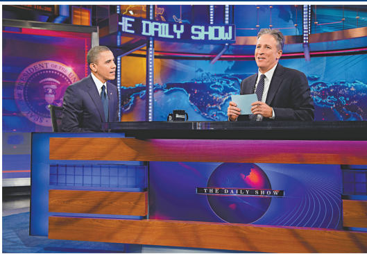
▲奧巴馬18日上《每日秀》節目談外交政策，爭取年輕選民支持