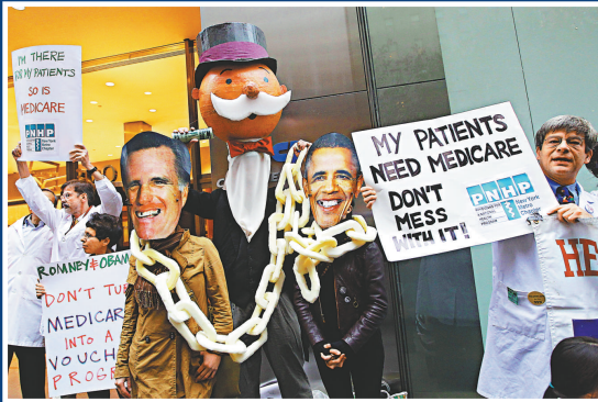
▲示威者18日頭戴羅姆尼和奧巴馬的面具，在晚宴會場門外示威