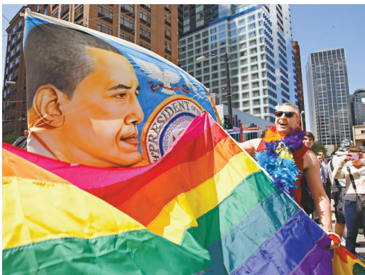
▲5月10日，活動人士手持彩虹旗和奧巴馬的頭像，支持同性婚姻

在美國的50個州中，有8個州已經承認了同性婚姻，其中包括首都華盛頓特區和麻省，紐約則是全美人口最密集的州。2012年5月9日，奧巴馬成為首位公開支持同性婚姻合法化的美國總統。不過，同性戀婚姻遭到基督教福音派教徒以及羅馬天主教會的堅決反對。