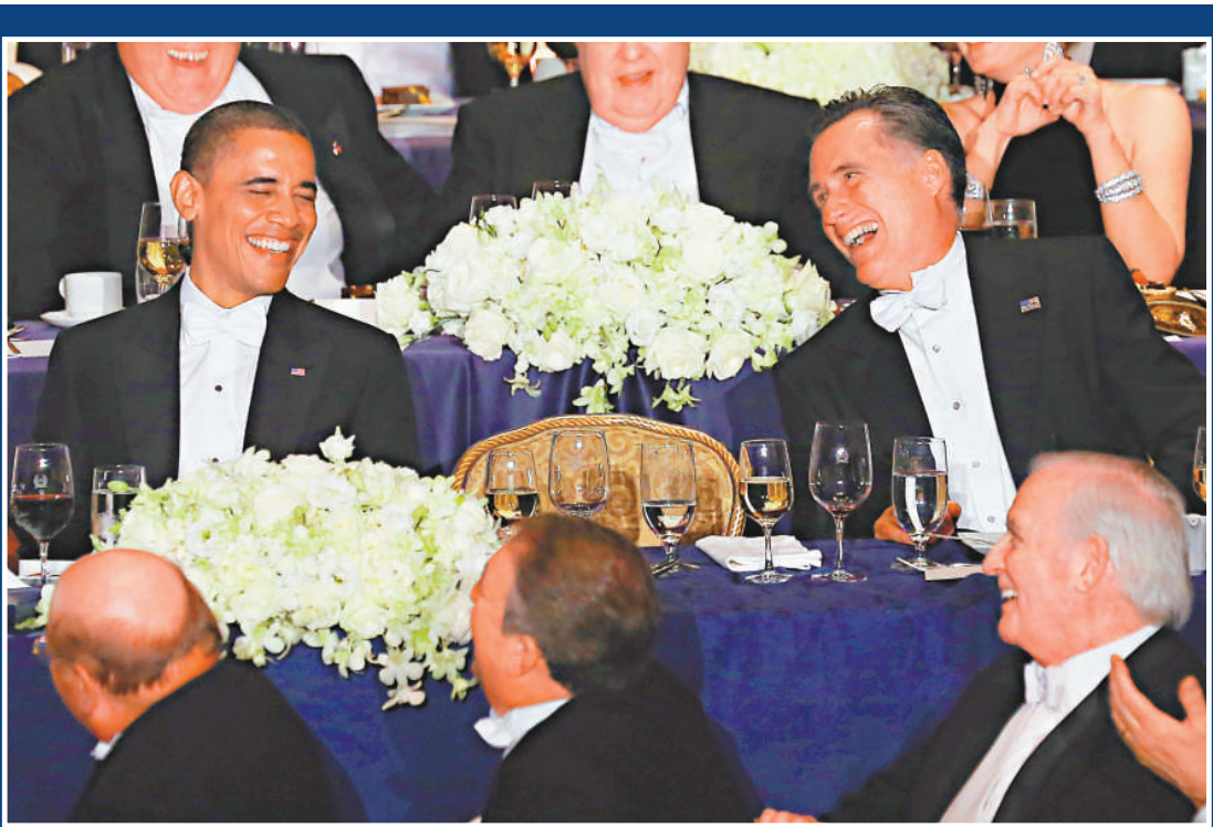
▲奧巴馬和羅姆尼18日一起出席慈善晚宴

根據18日的最新綜合民調顯示，羅姆尼的支持率領先奧巴馬1個百分點。但兩人在多個關鍵州的選情仍然膠着，難分勝負。