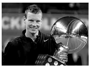
▲貝迪治在斯德哥爾摩網賽稱王