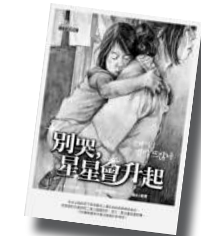
作者：辛相權（譯者：都勇） 出版社：新苗文化 出版日期：2005年5月10日

——同學嘗試用個人經歷配合所讀內容，進而思考人生。在分享中，同學多次提及自己被英子的故事所感動，並就此將英子的遭遇與自己的人生態度作出對比，有其意義，亦