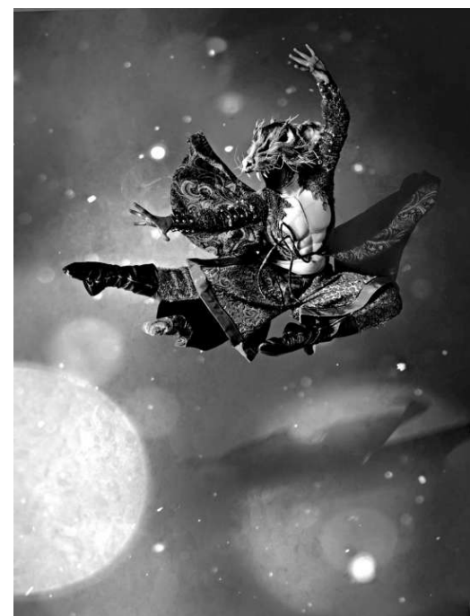
▲《胡桃夾子》劇照中的老鼠王