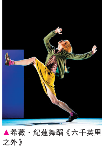
▲希薇·紀蓮舞蹈《六千英里之外》