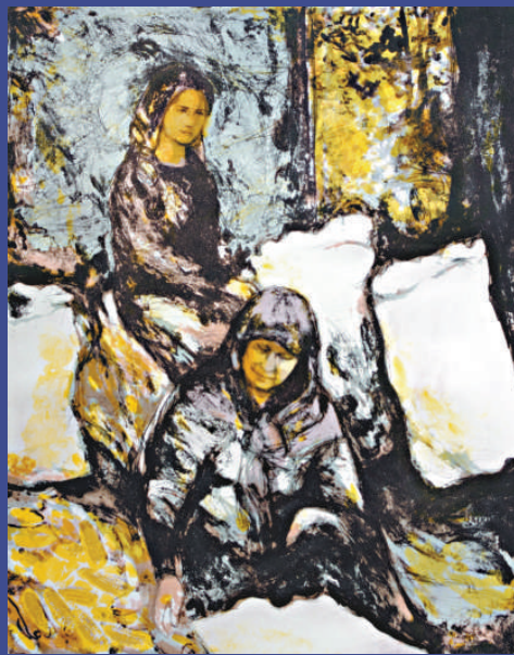
▲陳浩《秋色飄香》石版畫二〇〇七年