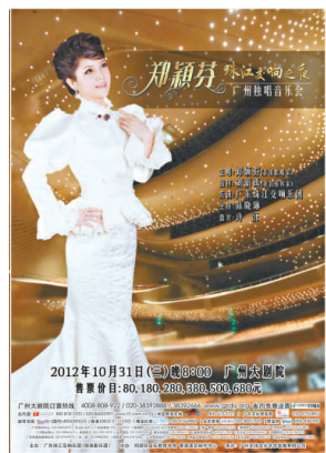
鄭穎芬廣州獨唱音樂會海報

【本報訊】香港歌壇名家鄭穎芬應廣州珠江交響樂團邀請，將於本月三十一日在廣州大劇院舉行「珠江交響之夜——鄭穎芬廣州獨唱音樂會」。鄭穎芬先後在維也納金色大廳、香港文化中心音樂廳和北京國家大劇院舉辦過大型的個人演唱會專場。