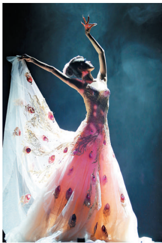
▲斯圖加特芭蕾舞團演出《茶花女》