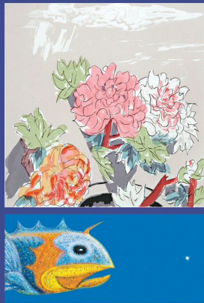
▲陳龍《魚》綜合版 二〇一二年