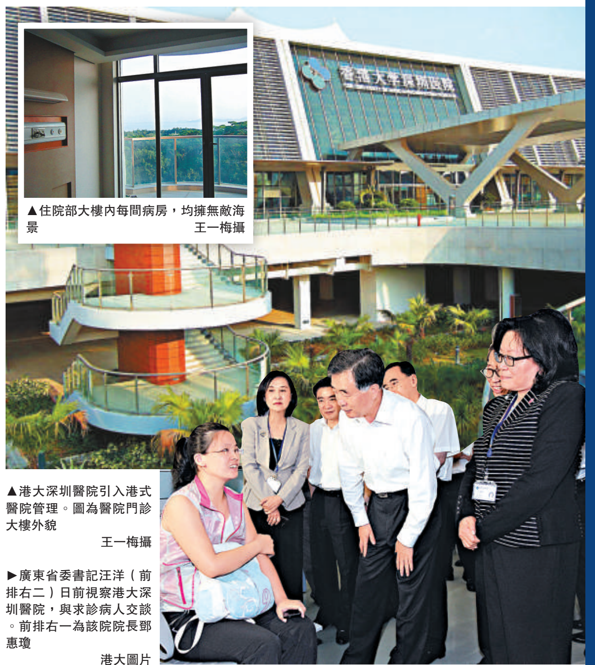
▲住院部大樓內每間病房，均擁無敵海景

由於位於深圳灣填海區，住院區的病房樓位於濱海大道北側的路邊，每間病房都設計有弧形陽台，患者步入陽台即可見到海景。住院部由四棟樓組成，而最靠近濱海大道的一棟五層樓房則為VIP特需診療中心。記者實地觀察後發現，VIP病房中最豪華的套房，廚房、吧枱、書房、客廳、客臥、主臥等一應俱全，且有3個洗手間和3個海景陽台。