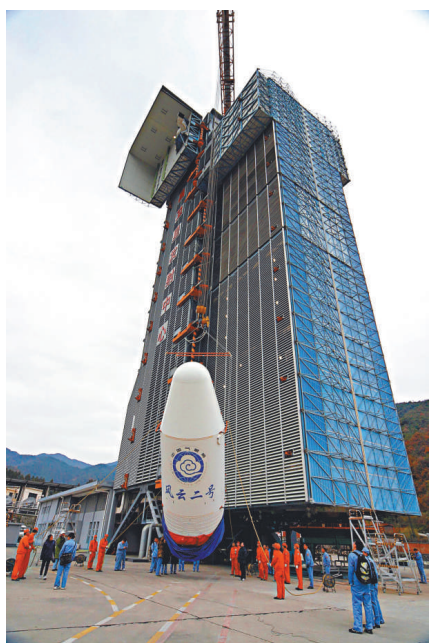
▲到2015年，中國氣象衛星有望於2小時內獲取全球氣象資料。圖為氣象衛星風雲二號 資料圖片

【本報訊】據中新社二十四日消息：中國氣象局24日在北京召開《中國氣象衛星及其應用發展規劃（2011-2020年）》（以下簡稱《規劃》）通報會議。會議上提出，中國將在2015年將全球氣象衛星觀測資料獲取時間縮短至兩小時以內，並計劃到2020年發射11顆氣象衛星。