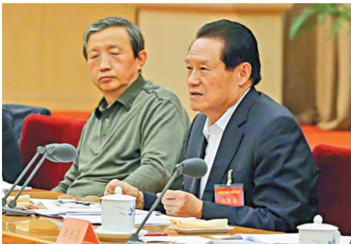
▲周永康強調，要毫不動搖地貫徹落實中央新疆工作座談會精神，咬定青山不放鬆，一茬接着一茬幹

近5年來，重慶市司法鑒定機構共辦理各類鑒定業務10萬餘件。其中，承擔市內外重大疑難案件鑒定300多件。陳明輝出任重慶市司法鑒定協會首任會長。