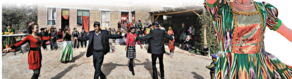
▼新疆民族關係近年日趨融洽，求發展、謀富裕、思穩定、盼和諧日益深入人心 新華社