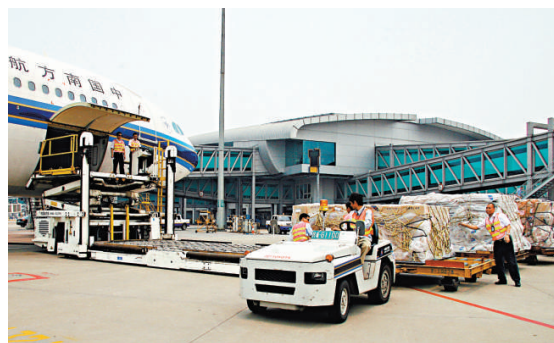
▲ 白雲機場綜合保稅區一期明年 3 月驗收運作，將促進機場貨運與物流的大發展

白雲機場綜合保稅區規劃面積達 7.38 平方公里，分為北區、中區、南區三個區域。其中，南區功能定位初步確定為加工區和倉儲配送區，以保稅加工、保稅貿易、研發製造為主，配套保稅物流和服務貿易；中區則以空港口岸操作為主，在保稅物流中心 (B