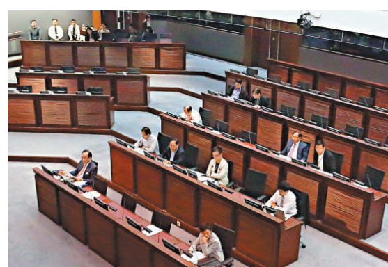
▲立法會昨舉行長者生活津貼聽證會

立法會福利事務委員會昨日以十一票贊成，兩票棄權，通過工黨議員張超雄提出的動議，要求中止待