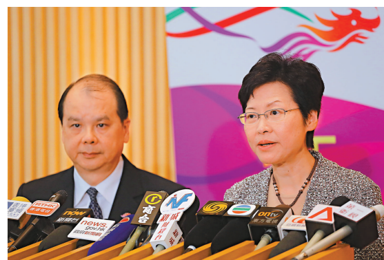
▲林鄭月娥（右）、張建宗呼籲立法會盡早通過撥款，讓長者受惠，並要求財委會下周二加開特別會議表決撥款

對於申請津貼的資產申報上限及入息審查問題，政府與立法會各政黨團體立場強硬。林鄭月娥表示，政府重視與立法會的關係，行政機關已做了大量解說工作，向立法會展示最大的誠意，不想見到任何長者透過長者生活津貼，能夠即時得到援助的可能性受損。