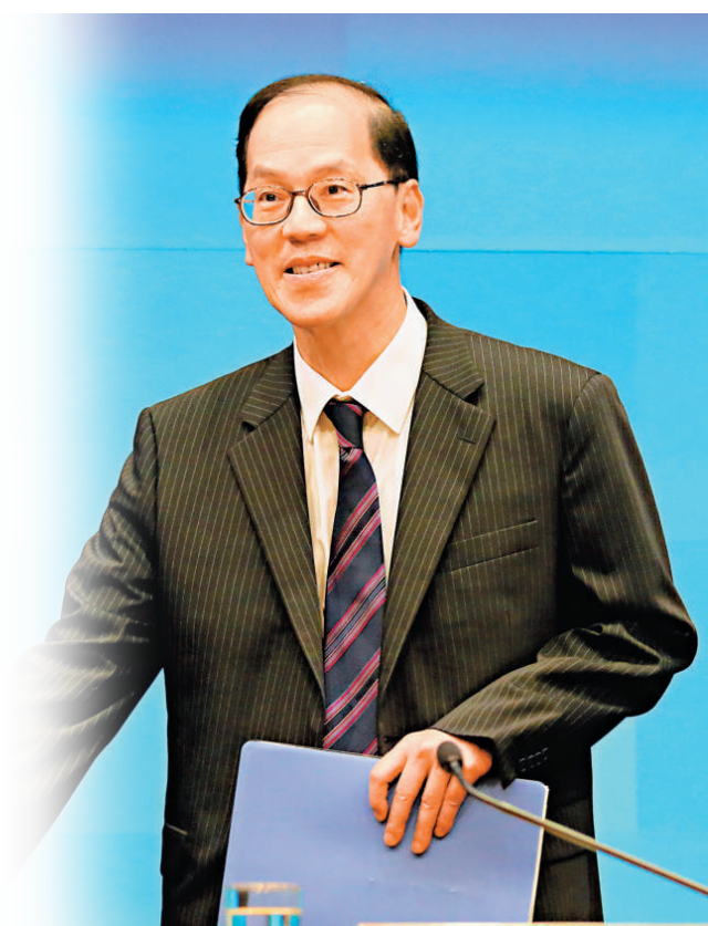
▲曾德成昨澄清，有關啓德體育城遷址欣澳純屬傳聞

針對啓德體育城會遷址或縮減興建規模的言論，民政事務局長曾德成昨日向傳媒澄清，有關說法「純屬傳聞」。即是說，政府不會將體育城遷往傳聞中的欣澳，亦不會騰出體育城的土地範圍來興建公屋。曾德成強調，負責體育城建設項目的民政事務局，會「按照原定計劃」推進籌備建設工作。