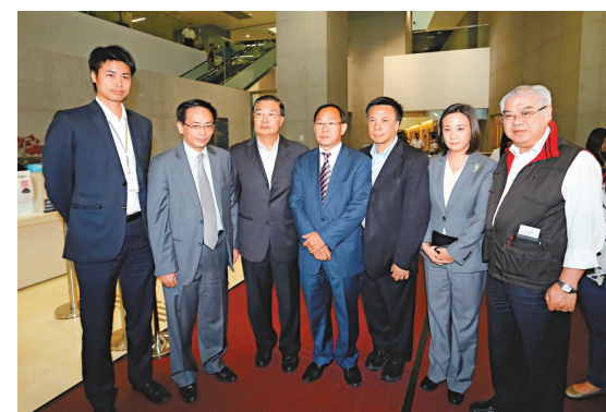
▲民建聯昨與林鄭月娥及張建宗會面，會上反映希望將資產審查上限，由約十八萬元提升到三十萬元

而民建聯主席譚耀宗與林鄭月娥及張建宗會面後表示，會上反映希望將資產審查上限，由約十八萬元提升到三十萬元，他引述林鄭月娥說，希望先通過議案，讓長者拿二千二百元，其後再就老年貧窮、退休保障等研究，並會推出短中長期措施。至於民建聯的投票意向，需下周二再開會決定，但不贊成中止待議議案。