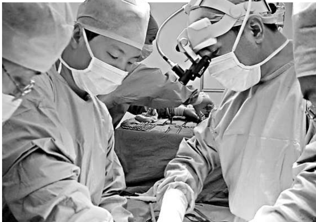
▲廣東省將形成覆蓋全省的醫患糾紛人民調解網絡，提供一個化解糾紛的第三方平台。圖為醫生正搶救病人

王輝表示，目前，全省各地市調解網絡正在延伸。廣東醫調委已成立肇慶市醫調委、陽江市醫調委、清遠市醫調委、湛江工作站和南海工作站等地方分支機構。梅州、茂名、湛江以及三水工作站已準備就緒，近期即將掛牌成立。東莞、中山、惠州、河源、雲浮、高明等地方醫調委正在協商擬成立，以期逐步形成覆蓋全省的第三方醫患糾紛人民調解網絡。