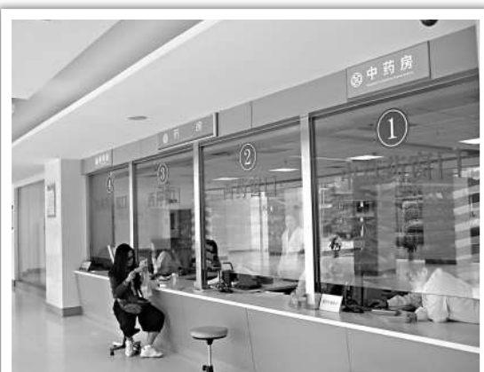
▲深圳民營醫院門庭冷落

同時，公立醫院實施藥品零差價銷售後，虧損部分由政府補貼，民營醫院卻不能享有這種待遇，越辦越窮。