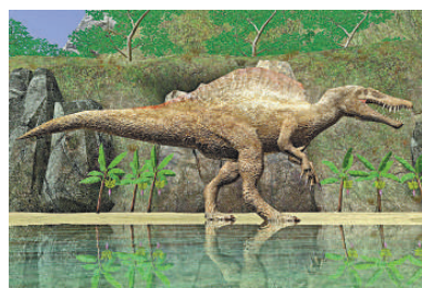
▲研究指恐龍進化出翼可能主要為求愛