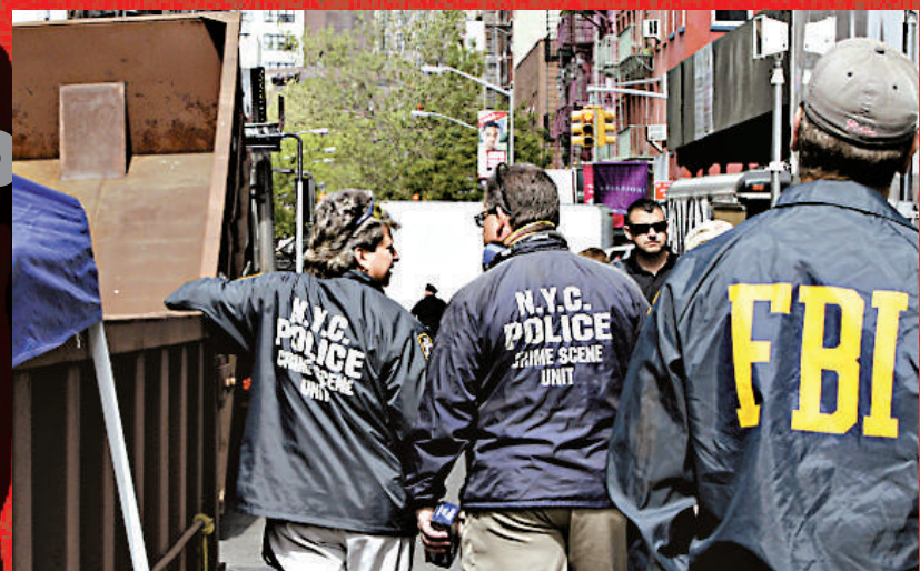
▲FBI和警方從瓦勒利的電腦中發現至少100名婦女的檔案資料