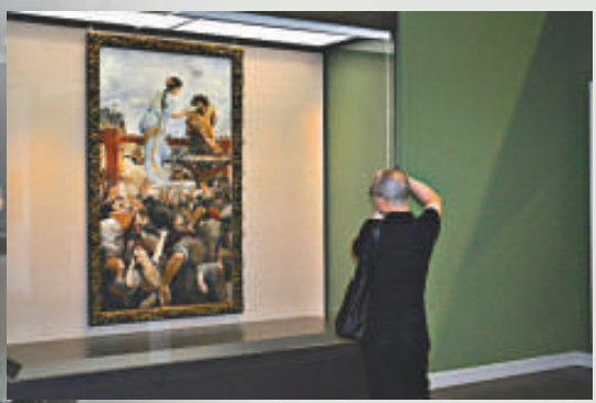
▲參觀者正在觀賞法國兩果博物館的展品