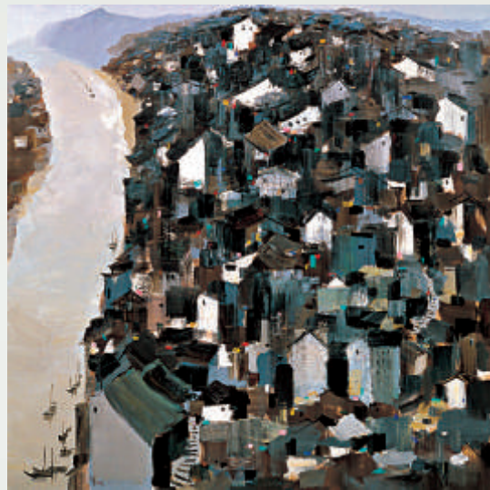
▲吳冠中《長江山城》，上海美術館藏