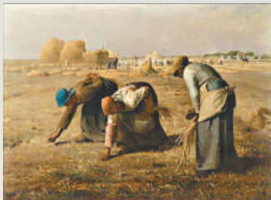
▲讓·弗朗索瓦·米勒的《拾穗者》，法國奧賽博物館藏