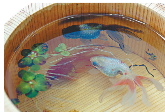
▲用木盆盛載的立體金魚作品

是次展覽展示深堀隆介最新的創作，當中包括以日本清酒器皿和木盆盛載的立體金魚作品，以及多張以不同媒介繪畫的平面畫作。「海港城·美術館」現化身成充滿日本文化氣息的空间，與參觀者分享深堀隆介的創作世界，展期至十一月五日。查詢電話：21188666。