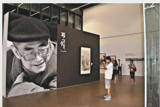
▲零米層的程十髮專館 本報攝