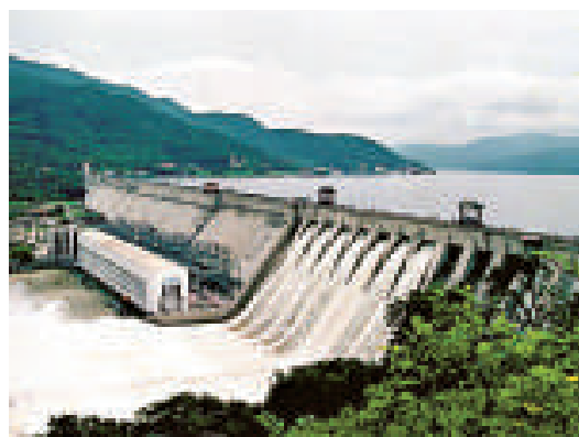
▲豐滿大壩1937年開工，迄今已經運轉70年

【本報訊】據中新社吉林二十九日消息：總投資達90.79億人民幣的豐滿水電站全面治理（重建）工程29日在吉林省吉林市正式開工。曾任豐滿發電廠副廠長、總工程師的全國人大常委會原委員李鵬專程發來賀信。