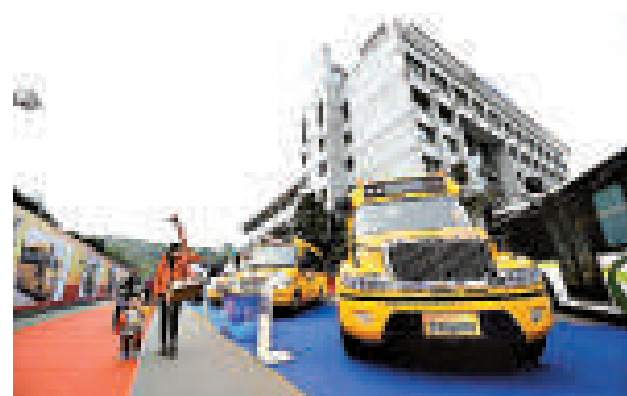
▲生物醫藥，電動汽車等新興產業在科交會上受到關注 網絡圖片

據統計，2012科交會共收集科技成果10806項，收集技術需求427項，收集投融資需求244項，全部製成光碟對外發布。大會期間，組織了近18場科技成果對接洽談會、投資推介會和經驗交流會，現場解決和協議解決了90多項技術難題。經過前期洽談、對接，共簽訂了各類科技合作項目230個，簽約金額達147.992億元。