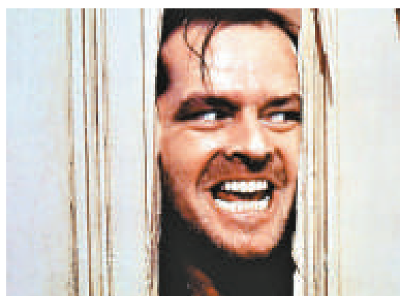
▲荷里活影星積尼高遜主演的經典恐怖片《閃靈》是消耗脂肪效果最好的恐怖片 資料圖片