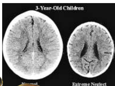
▲研究顯示，從小受母親忽略的兒童的大腦遠小於一般兒童 互聯網

美國加州大學洛杉磯分校教授蕭爾表示，如果寶寶在兩歲前未獲得適當對待，會對往後的發展產生十分重大影響。他們攸關聰明等功能的基因無法運作，而這些基因有可能永遠不會發展和出現。