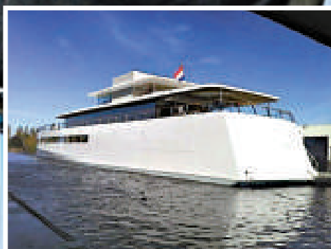
▲風格簡約的「維納斯」 互聯網