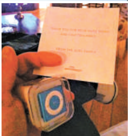
▲參與該船建造的每個人都獲贈了一部 iPod Shuffle 以及寫有感謝語的字條 互聯網

荷蘭科技博客 One More Thing 報道，喬布斯的家人將前往荷蘭阿爾斯梅爾村，出席 Feadship 造船廠的遊艇下水典禮。