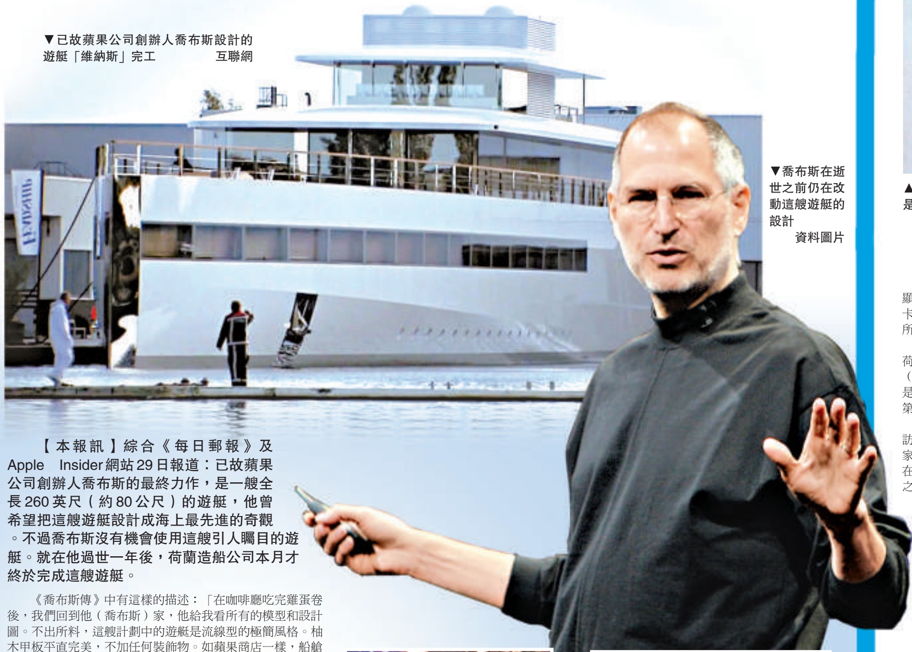
▼喬布斯在逝世之前仍在改動這艘遊艇的設計 資料圖片

【本報訊】綜合《每日郵報》及 Apple Insider 網站 29 日報道：已故蘋果公司創辦人喬布斯的遺作，是一艘全長 260 英尺（約 80 公尺）的遊艇，他希望把這艘遊艇設計成海上最先進的奇觀。不過喬布斯沒有機會使用這艘引人矚目的遊艇。就在他過世一年後，荷蘭造船公司本月才終於完成這艘遊艇。