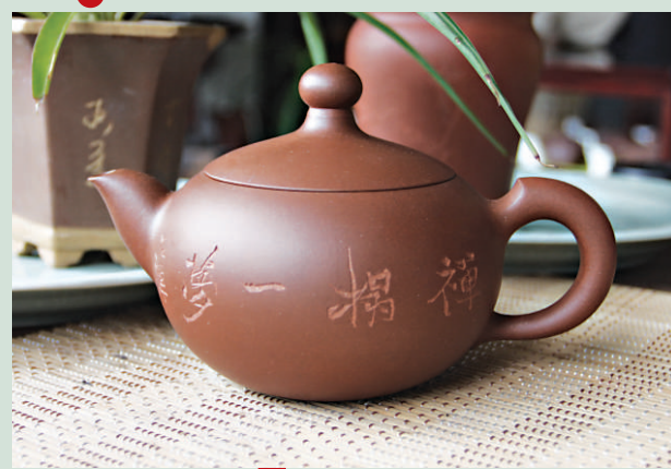
▲文人畫家石禪鑄刻作品——禪榻一夢（楊維高製壺）