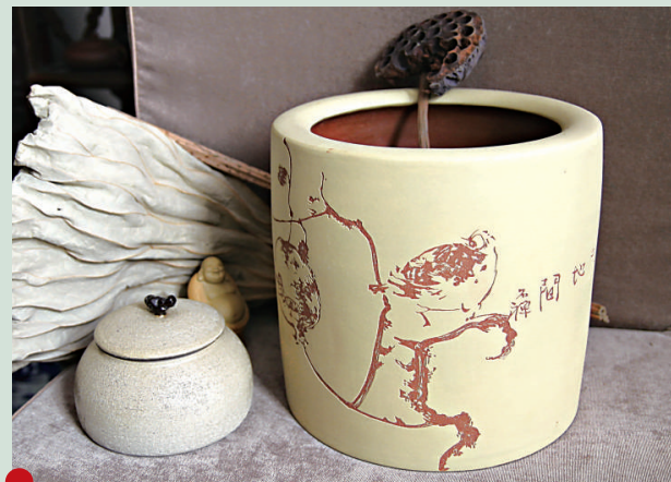
▲文人畫家石禪鑄刻作品——筆筒