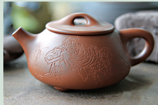
▲文人畫家楊春華鑄刻作品——石瓢壺