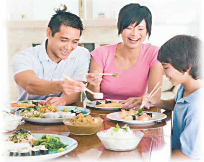
◀現今社會代溝問題嚴重，主因是一家人圍枱吃飯的機會愈來愈少 網絡圖片