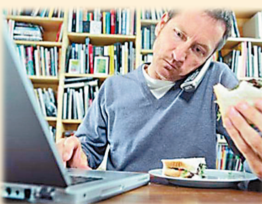
▲邊食邊做除影響員工健康，更是導致上班族肥胖的主因 網絡圖片