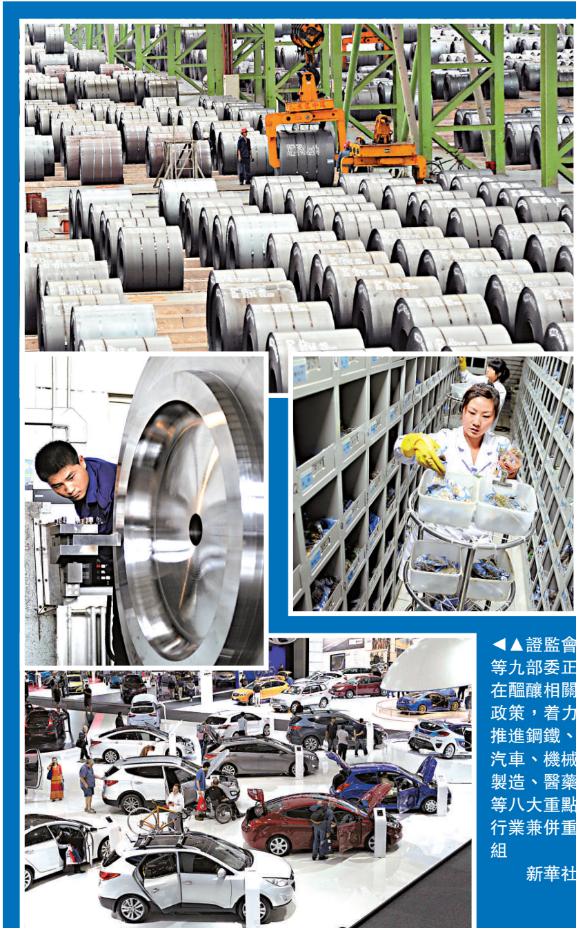
◀證監會等九部委正在醞釀相關政策，着力推進鋼鐵、汽車、機械製造、醫藥等八大重點行業兼併重組