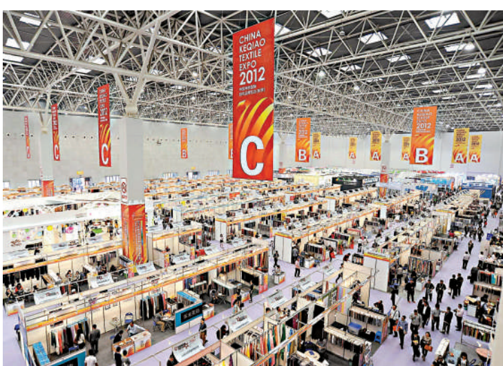
◀此次共設展位1309個，為歷屆秋季紡博會之最海外買家現場採購

紡博會的配套活動——海外買家見面會獲得了參展商的一致好評。此次海外買家見面會初期報名近百家，經過了嚴格的資格審查、信息審核之後，挑選出50餘位海外採購商前來參加，其中40%來自歐美，60%來自南美、亞洲、非洲等地，更有多位採購商帶著訂單前來。供應商認為，此類見面會可以在幾個小時之內認識來自全球各地的採購商，增加合作的可能性同時，也增加很多商機。