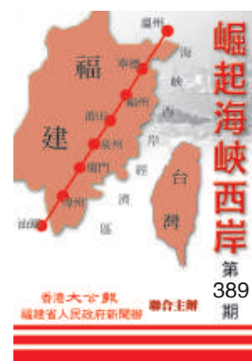
崛起海峽西岸 第389期