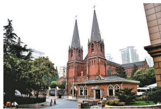
▲上海徐家匯天主教堂

如今成國家「4A」級旅遊景區，融入這一景區的徐家匯天主教堂、徐家匯觀象台、徐家匯藏書樓、徐匯公學舊址、百代公司舊址、聖母院舊址以及徐光啓墓和徐光啓紀念館等一批歷史文化遺跡將免費向公眾開放。