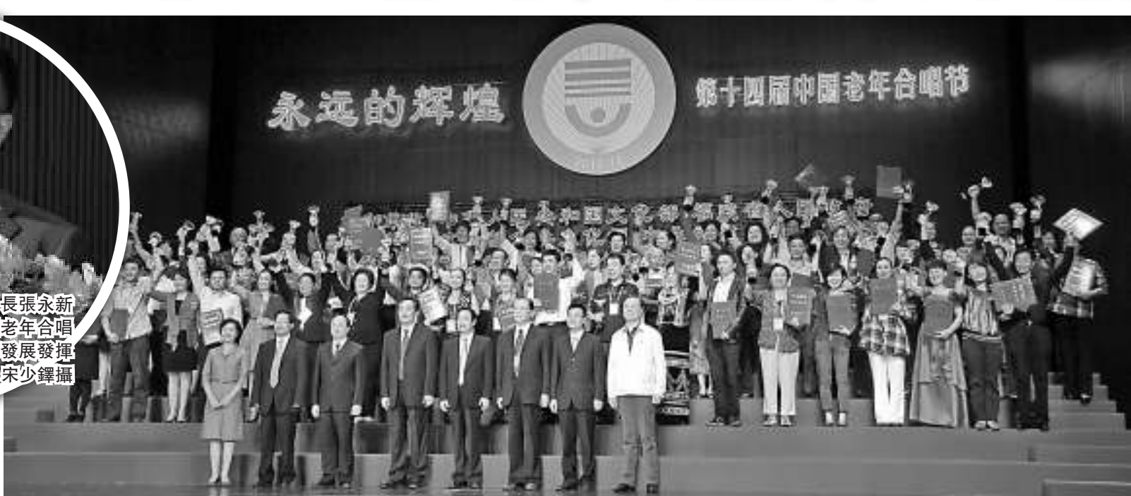
▲第14屆老年合唱節在福州閉幕，獲獎團體集體登台大合照