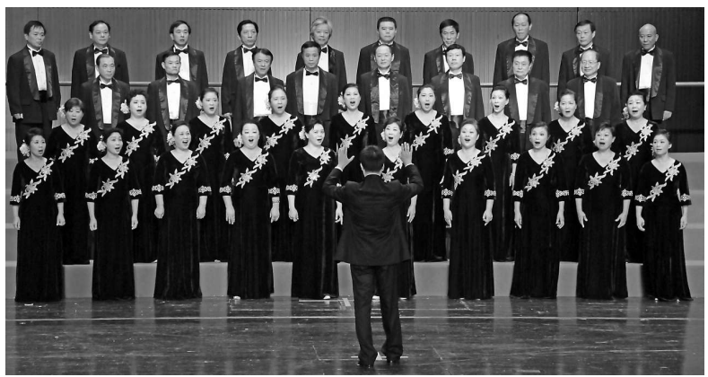
▲福建水之聲合唱團演唱交響音樂《智取威虎山》選曲《乘勝進軍》，展示了很高的合唱藝術

據介紹，中國老年合唱節自從1998年創辦至今，已經從一項促進老年群眾自娛自樂的活動，轉變為越來越專業的歌唱比賽。服裝方面，每支隊伍都經過精心的設計。無論是極具特色的少數民族服裝，還是素雅大氣的