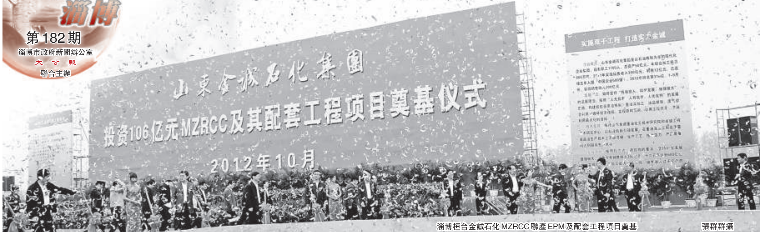
淄博桓台金誠石化MZRCC聯產EPM及配套工程項目奠基