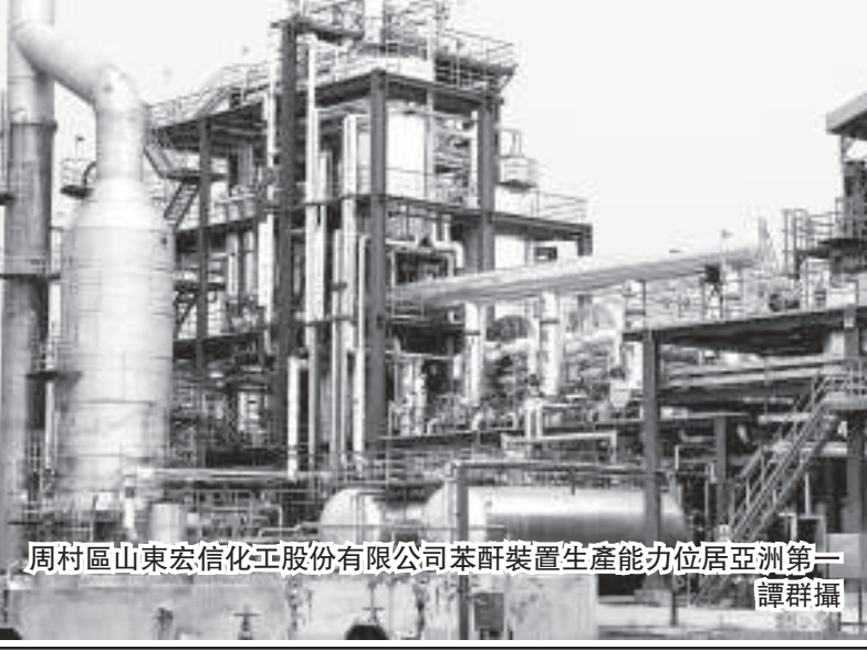
周村區山東宏信化工有限公司苯酞裝置生產能力居亞洲第一

今年以來，面對國內外複雜嚴峻的經濟形勢，淄博積極應對，把項目建設作爲推動全市科學發展的總抓手，以項目建設的新成效，帶動穩增長、調結構、惠民生、保穩定各項工作開展，實現了經濟逆勢發展，前三季度實現地區生產總值（GDP）2706.5億元，按可比價計算，同比增長10.1%。全市規模以上工業增加值增長11%，實現主營業務收入7446.3億元，同比增長11.2%，社會消費品零售總額、固定資產投資、進出口總額同比增長14.8%、20.3%、9.1%。