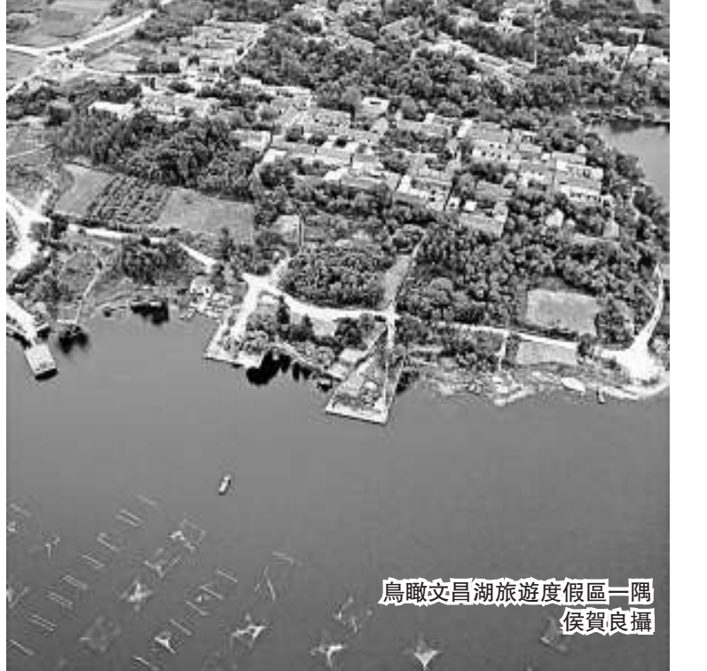
鳥瞰文昌湖旅遊度假區一隅