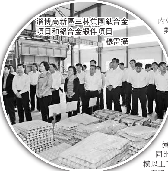
淄博高新區三林集團鈦合金項目和鋁合金鍛件項目