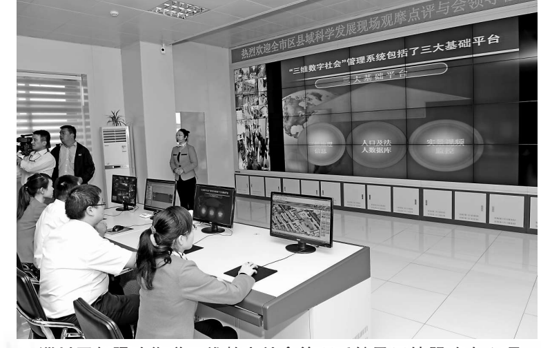
▲淄川區般陽路街道三維數字社會管理系統及民情服務中心項目

面對經濟下行壓力，淄博市明確提出，今後幾年，要把項目建設作爲推動全市科學發展的總抓手，把「發展發展再發展，實幹實幹再實幹」作爲今後工作的總基調。 在最近一次全市經濟運行分析會議上，淄博市委書記周清利要求全市各級，搶抓當前特殊時期的重大機遇，以堅韌不拔的精神，積極搭建平台，匯聚優質要素，策劃新上建設一批對長遠發展具有支撐作用的大項目、好項目。淄博市委副書記、代市長徐景顏要求，各級搶抓經濟低谷時期的重要機遇，全力加快在建項目建設進度，迅速啓動一批具備開工條件的項目，抓緊展開明年重點項目的策劃爭取工作，爲即期增長注入動力，爲長遠發展積攢後勁。 淄博市各區縣積極行動，迎難而上，全力以赴抓項目、抓投入，努力增創科學發展新優勢。 張店區作爲淄博市的中心城區，堅持發展爲了幸福、幸福引領發展的理念，着力打造現代產業之城、創新創業之城、生態宜居之城、文化教育名城、平安和諧之城；淄川區大力實施轉型升級戰略，以創新引領爲動力，加快建設富饒秀美幸福新淄川；博山區深入實施「一核二區三片」發展規劃，全面建設以富裕、生態、文化、幸福、平安爲標誌的活力博山、魅力山城；周村區狠抓科技工業、服務型經濟、宜居休閒城市建設，努力打造「富而強、精而美」的幸福周村；臨淄區着力提高群眾幸福指數和城鄉文明程度，全力建設生態和諧文明現代化臨淄；桓台縣深入實施「一個中心四個片區」規劃，着力打造實力桓台、建設幸福城鄉；高青縣堅持以城鎮化爲統領，以工業化爲龍頭，統籌推進農業現代化，加快建設開放和諧秀美新高青；沂源縣牢固樹立民生爲先、