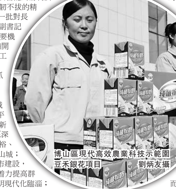
博山區現代高效農業科技示範園 豆禾銀花項目

博山區在放大傳統優勢基礎上，積極轉方式調結構，策劃實施了一批高精尖項目。今年，全區千萬元以上在建項目達到341個，過億元項目59個。其中，山東晶鑫晶體科技有限公司新上的藍寶石晶體材料項目，產品附加值高，建成達產後可實現年銷售收入200億元、利潤30億元。項目建設推動了產業結構調整，全區經濟社會呈現出健康穩定協調發展的良好態勢。