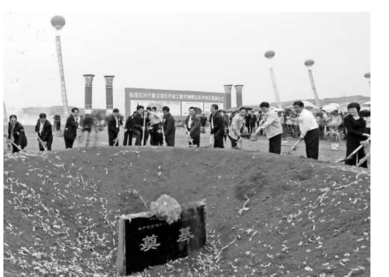
▲臨淄區36個重點項目開工奠基儀式

在國內經濟增長放緩的大背景下，山東宏信化工股份有限公司堅持以科學發展觀爲統領，以轉方式、調結構爲目標，不斷加大投入，強化